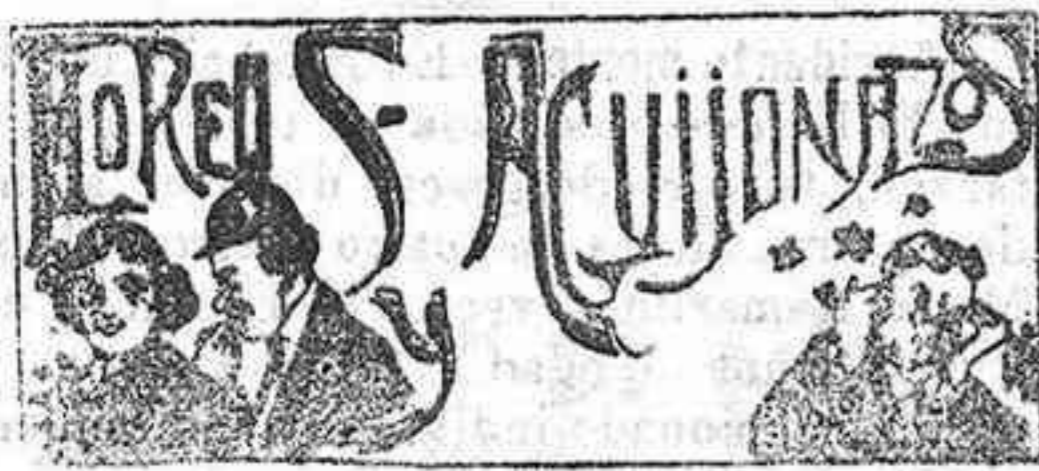
Villancicos para esta noche

Esta noche es Nochebuena; toca, Rosita, el piano y anda y cántale una copla a nuestro alcalde Solano.