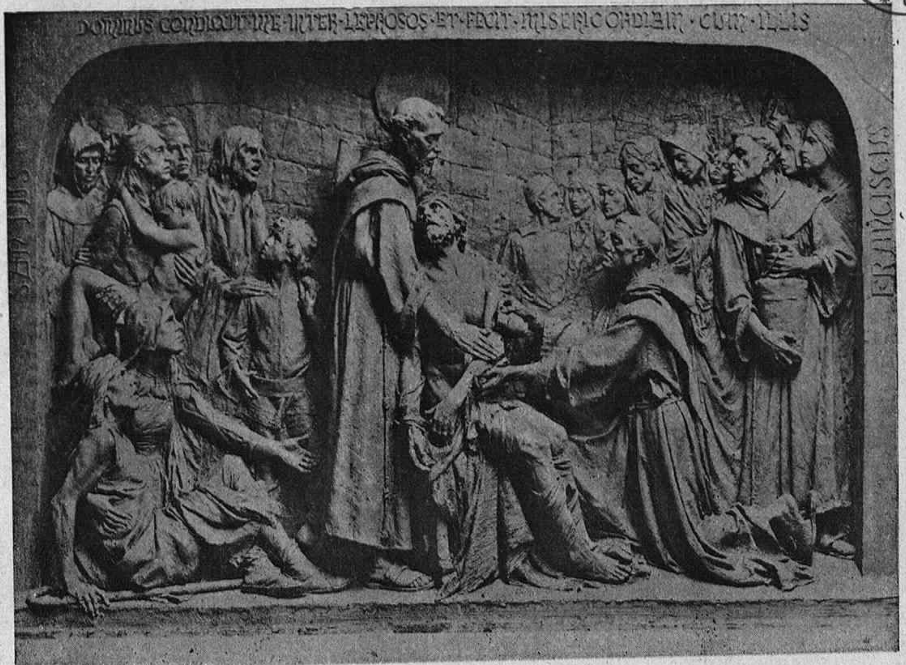
ALTO RELIEVE DE QUEROL