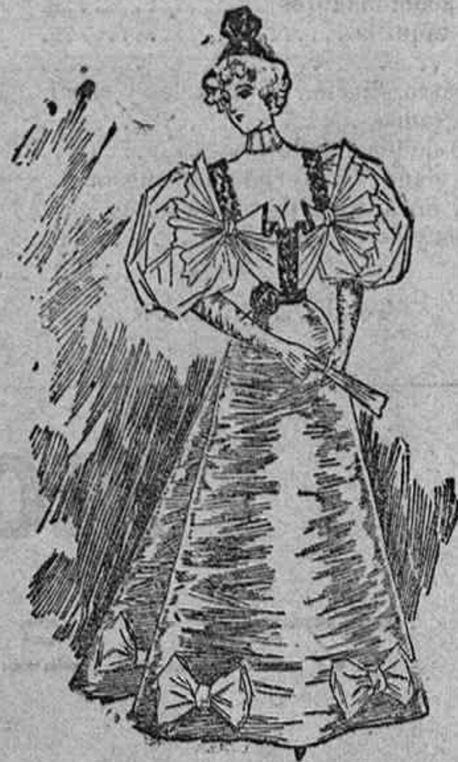
¡Traje de baile para señorita.

Modelos exclusivos para nuestras lectoras, de los Grandes Almacenes de EL SIGLO, Barcelona (1.)