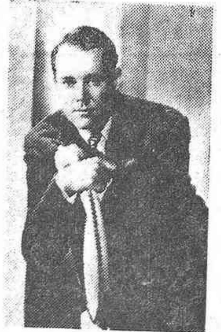
Henry Fonda, el famoso galán de la pantalla, que en "Noche eterna", el éxito triunfal de Exclusivas Fioralva, ya en segunda semana en el lujoso cine Avenida, realiza la mejor interpretación cinematográfica de su brillante carrera en la pantalla

Todos los que ven "Noche eterna" reconocen maravillados que en la nueva estrella Barbara Bel Geddes alienta una actriz de extraordinarias condiciones artísticas, como lo ha demostrado al protagonizar "Noche eterna", la película triunfal del Avenida.