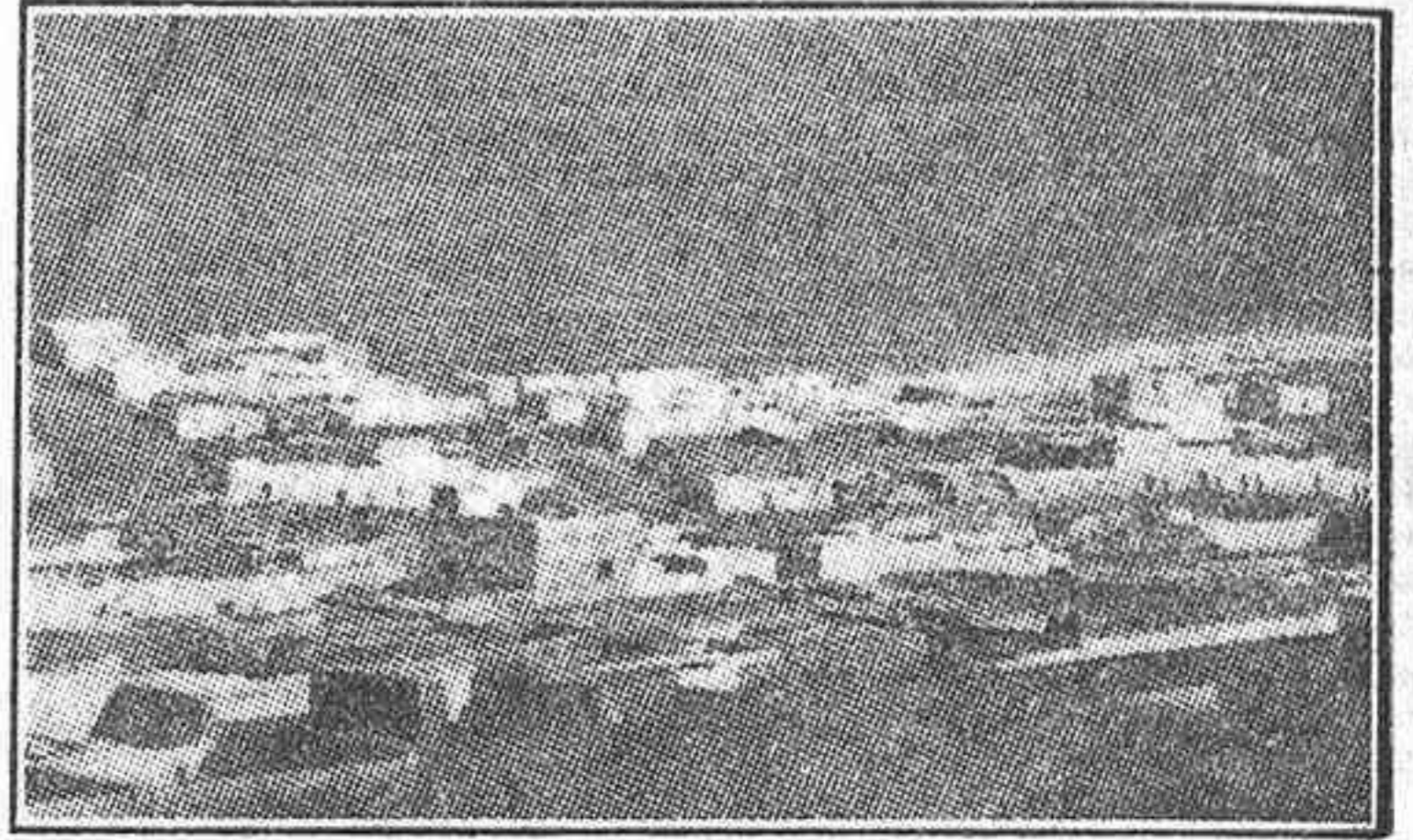
Una vista de Ifni

EN la actualidad nacional del día se entrelaza una efeméride feliz con un hecho luctuoso: el décimoquinto aniversario de la ocupación de Ifni y el fallecimiento del general Bens, Adelantado de España en el África occidental española.