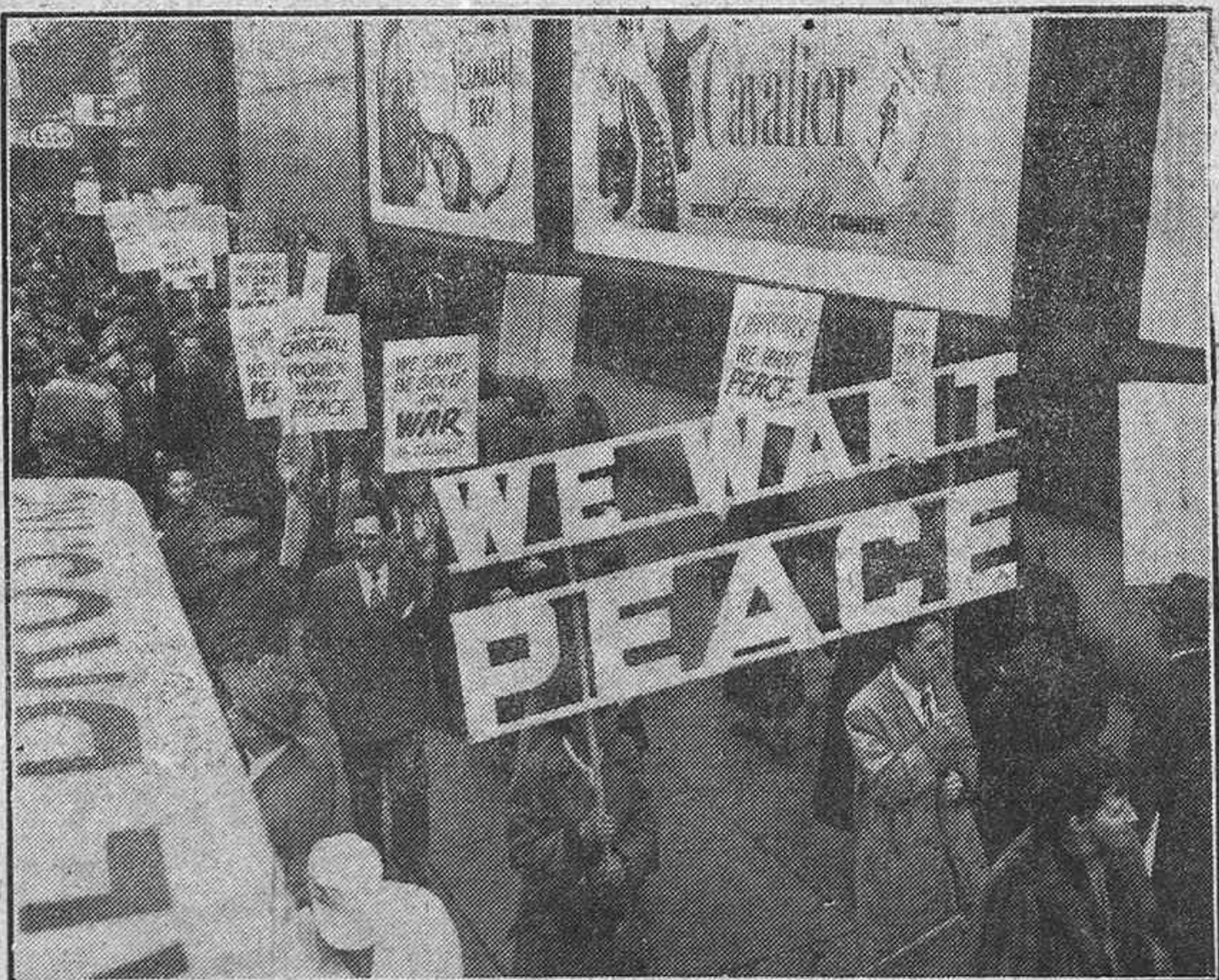
LOS AMIGOS NEYORKINOS DE LA UNION SOVIETICA HICIERON A WINSTON CHURCHILL UN RECIBIMIENTO ESPECTACULAR, EN EL QUE NO FALTARON NI LOS CARTELES NI LOS GRITOS MAS O MENOS APASIONADOS. EL CONSEJO DE LA AMISTAD "RUSOAMERICANA", ORGANIZADOR DE LA MANIFESTACION, HA SIDO RECIENTEMENTE ACUSADO DE SUBVERSIVO POR EL FISCAL GENERAL, TOM CLARK