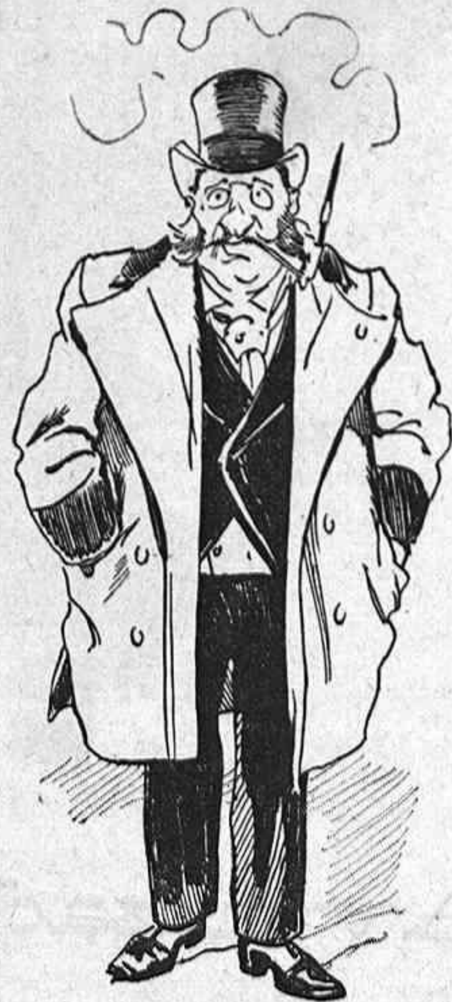
Un ganso del Capitolio.