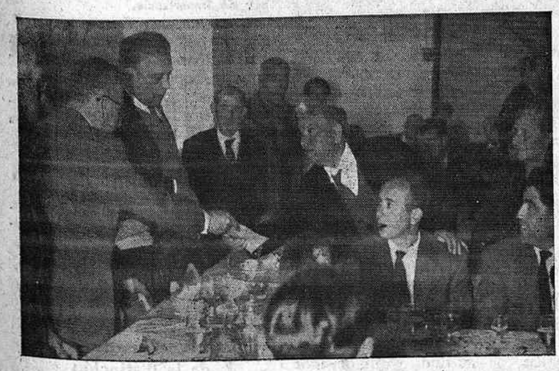
El delegado provincial de Sindicatos, entrega los donativos concedidos por la Hermandad para productores jubilados o enfermos

Comienza el horario de verano para espectáculos y establecimientos públicos Desde el pasado domingo ha empezado a regir el horario de verano para espectáculos y establecimientos públicos, a tenor de la orden del Ministerio de la Gobernación del pasado 18 de enero. En su consecuencia, la hora de cierre, de junio a septiembre, ambos incluidos en su totalidad, es la siguiente: Cines: A las 24'30. Teatros: A las 24'45. Los que cultiven género lírico o gran espectáculo, a la una de la madrugada. Espectáculos al aire libre; Una de la madrugada. Verbenas, kermeses y fiestas populares análogas: 1'30 de la madrugada. Restaurantes, cafés, cafeterías, bares y establecimientos similares: A las dos de la madrugada. Tabernas: A las doce de la noche.