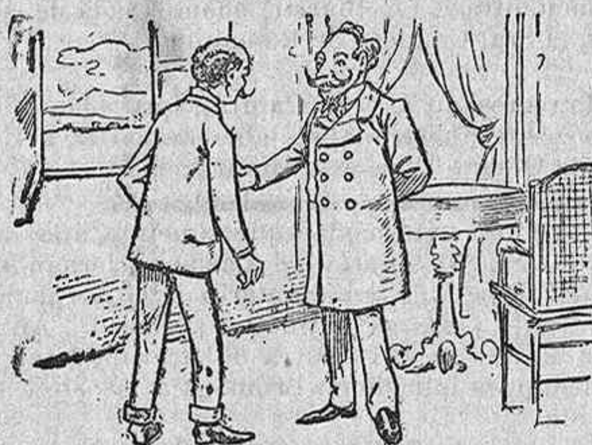
En el balneario

—Yo creía que, como todos los años, venía usted á tomar las aguas por distracción. Hoy veo con placer que está usted realmente enfermo y que las necesita.