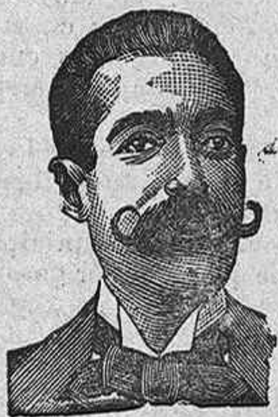
A. SALVATI COSTANZI CALLE DIPUTACION 435 BARCELONA

BOTELLA, 3'50 PESETAS.—De venta en todas las farmacias y droguerías.—Depósito: droguería de Pérez del Molino y Compañía, calle de la Compañía y plaza de las Escuelas.