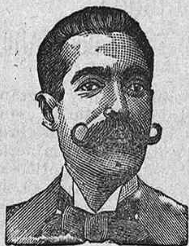
A. SALVATI COSTANZI CALLE DIPUTACION 435 BARCELONA