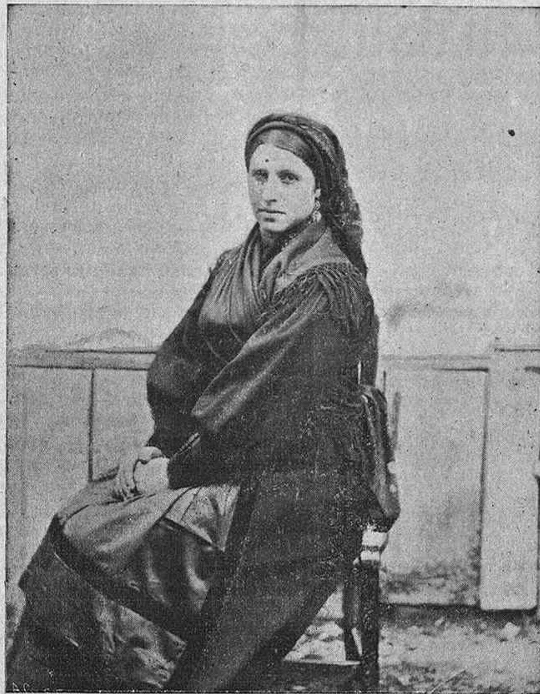
TIPO DE GALLEGA CORUÑESA