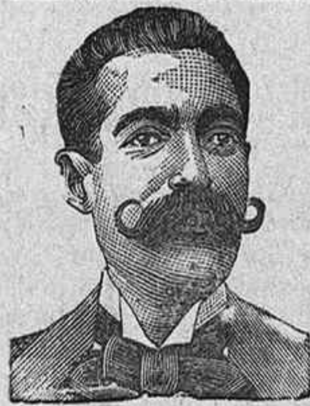
A. SALVATI COSTANZI CALLE DIPUTACION 435 BARCELONA