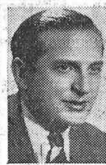
J. Calvo Sotelo