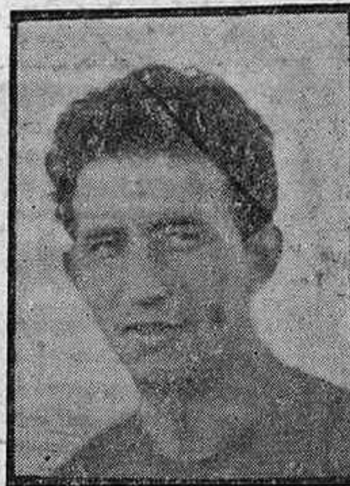
Ollás y Doalto: un ala peligrosa incisiva y realizadora.

desdibujando el juego de los locales que no acertaban en el futbol de conjunto y encontraban muchas dificultades para ir en busca del gol.