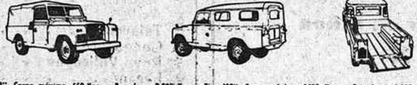
*Tipo 88". Carga máxima, 650 Kgs. - Remolque, 2.000 Kgs. - Tipo 109". Carga máxima, 1.100 Kgs. - Remolque, 2.000 Kgs.

FABRICADO POR METALURGICA DE SANTA ANA, S. A. OFICINA CENTRAL: ALCALA, 95 - MADRID-9.