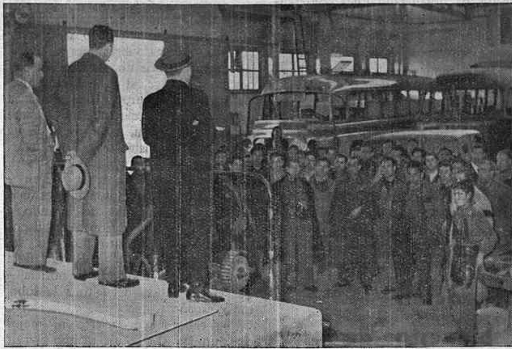
Un momento del acto de orientación electoral celebrado en "Industrias Plaza", de esta capital. (Foto Andrada).

En Durón, la empresa CORSAN, S. A., de Obras Públicas, con 208 obreros, han elegido dos Enlaces;