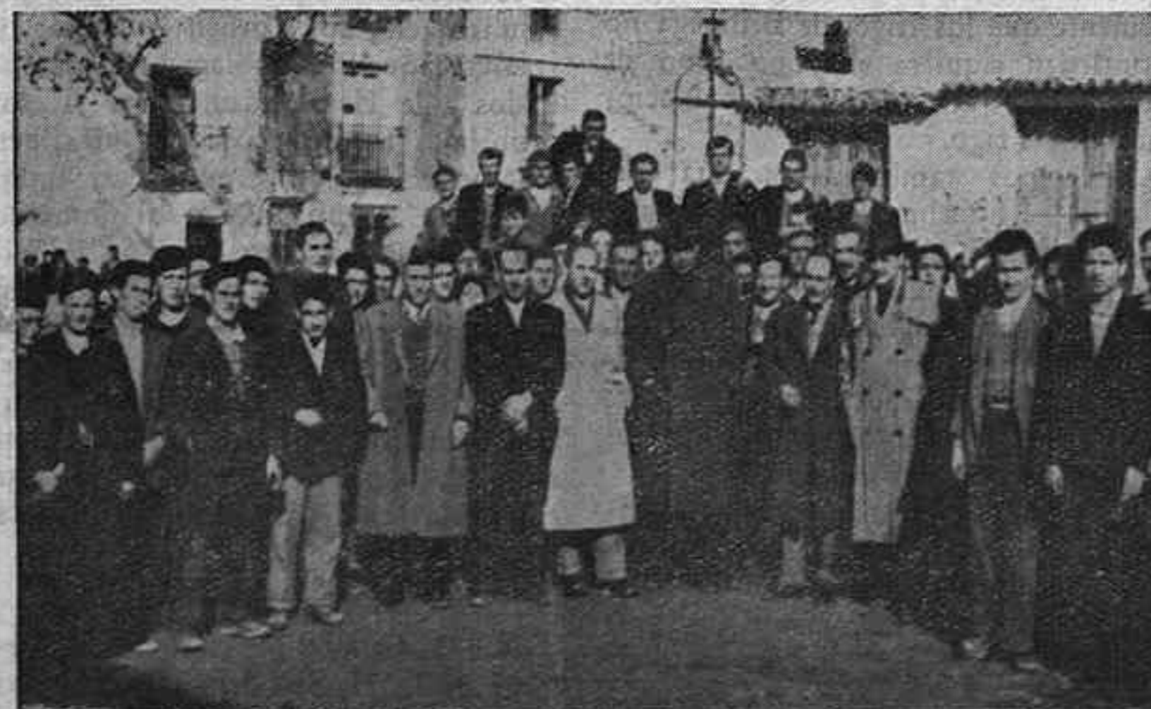
Grupo de cursillistas de Illana.

El vigente Reglamento del Trabajo en la construcción considera en su artículo 13, como personal fijo de obra a aquel que contratado para una obra o trabajo determinado, llega a alcanzar en sus relaciones laborales con la Empresa un mínimo de tiempo de seis meses; como el consultante en el pasado ya ese período ha adquirido la categoría de obrero fijo de obra, por lo tanto, la indemnización que le corresponde es la de una semana de salario y un plazo de preaviso de otra, según determina el artículo 14 del referido Reglamento, salvo el caso de que el despido lo sea por terminación de obra, en el cual, el trabajador puede ser despedido sin ninguna clase de indemnización y sin que el empresario tenga que cumplir otro requisito que avisar el despido con una semana de antelación.