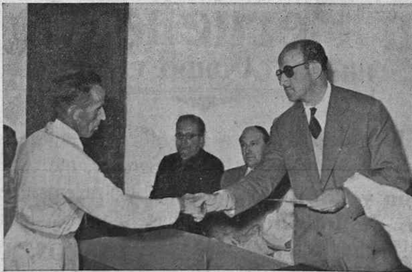
Un momento de la entrega de premios por el Excmo. Sr. Gobernador Civil y Jefe Provincial del Movimiento, a los productores que se distinguieron por su aplicación en el cursillo celebrado en el Pantano de El Vado.