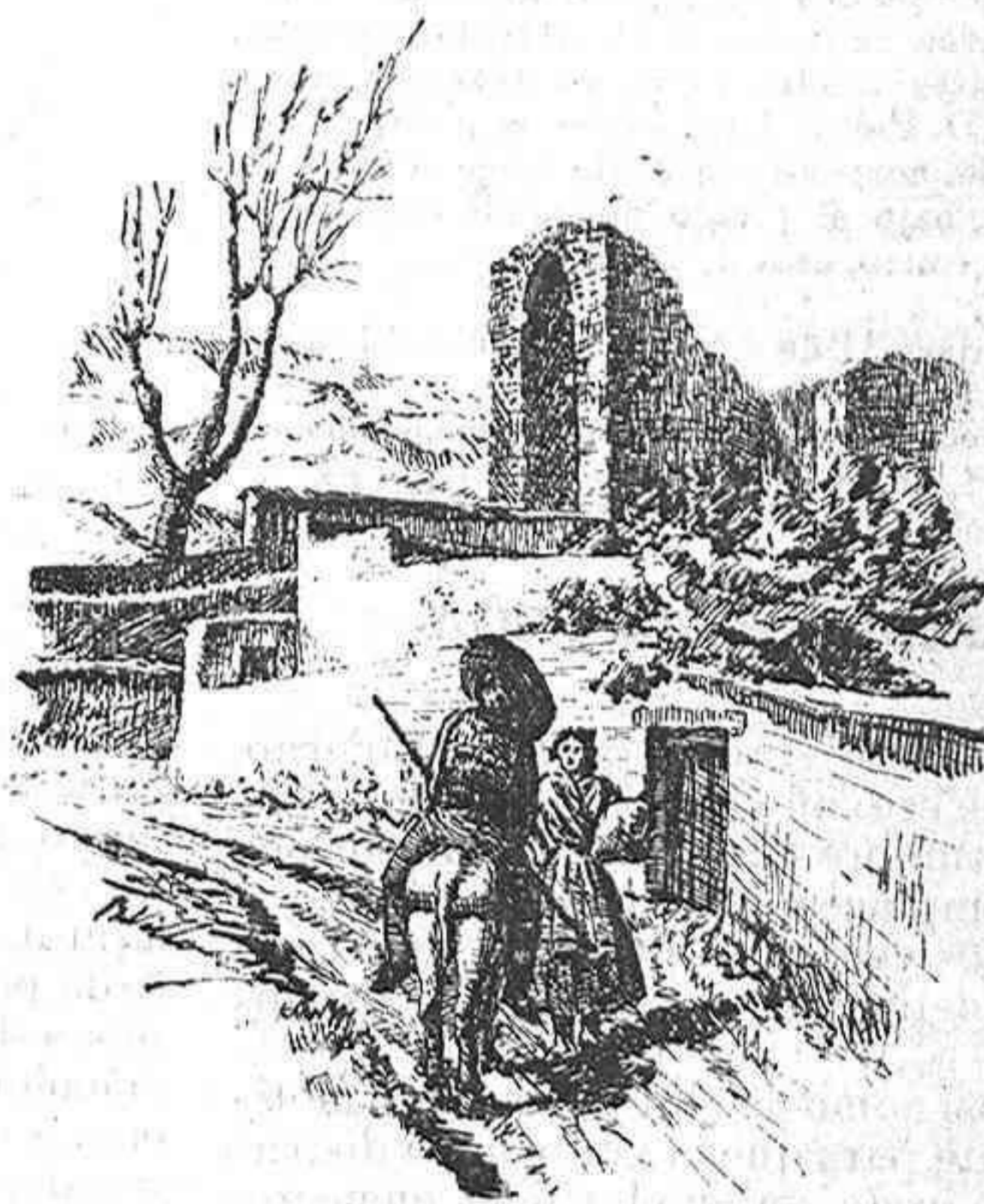
Arco de Pozavón