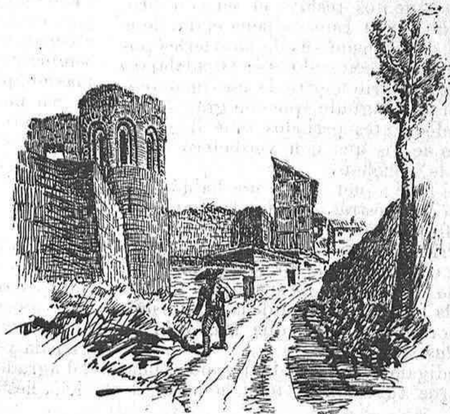
Bajada a los Molinos