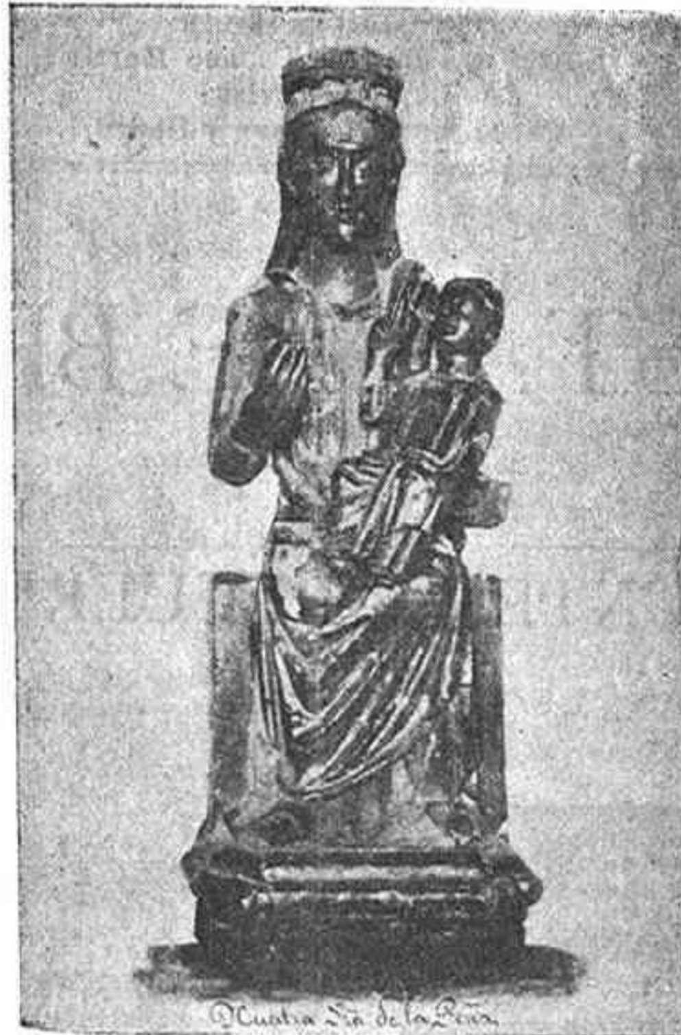
PATRONA DE BRIHUEGA

Quien no haya presenciado nunca el encierro de los toros de Brihuega, no puede comprender el gran atractivo que dicha fiesta tiene para todos los hijos de esta pacífica comarca.