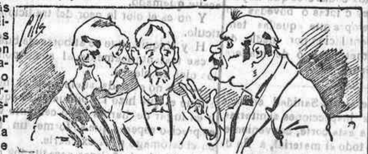
Abominar á nuestros libros... pero los compran.

Todas las personas de gusto, curiosas é ilustradas deben pedir al Director de LA AVISPA, apartado núm. 8, MADRID, un ejemplar que se remite gratis y franqueado. Esta Revista Enciclopédica Popular publica recreaciones científicas, recetas de cocina, repostería, confitería, vinos, licores, pinturas, barnices, betunes y fórmulas para toda clase de industria, y cuantas noticias y conocimientos puedan ser beneficiosos. Cuenta además con buenos grabados, parte literaria excelente; da regalos mensuales á sus lectores con la Lotería Nacional y participaciones en la misma, á cuyo efecto compra todos los sorteos, y en una de las Administraciones más afortunadas por la suerte, billetes enteros. La suscripción y los números que se nos pidan se sirven gratuitamente á correo vuelto y franqueados, con sólo indicar el nombre y dirección de la desea en sobre dirigido al Sr. Administrador de