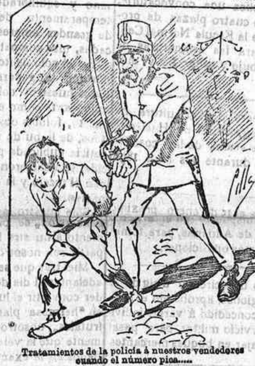
Tratamientos de la policía á nuestros vendedores cuando el número pica.....

También puede pedirse LA AVISPA y el CATALOGO RESERVADO en casa de nuestros corresponsales autorizados, si no se quiere escribir á la Administración.