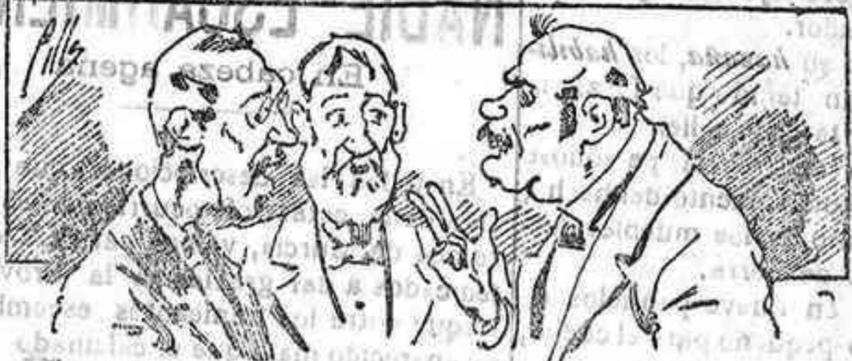
Abominas á nuestros libros... pero los compran.

Todas las personas de gusto, curiosas é ilustradas deben pedir al Director de LA AVISPA, apartado núm. 8, MADRID, un ejemplar que se remite gratis y franqueado. Esta Revista Enciclopédica Popular publica recreaciones científicas, recetas de cocina, repostería, confitería, vinos, licores, pinturas, barnices, betunes y cuantas noticias y conocimientos puedan ser beneficiosos. Cuenta además con buenos grabados, parte literaria excelente; da regalos mensuales á sus lectores con la Lotería Nacional y participaciones en la misma, á cuyo efecto compra todos los sorteos, y en una de las Administraciones más afortunadas por la suerte, billetes enteros. La suscripción y los números que se nos pidan se sirven gratuitamente á correo vuelto y franqueados, con sólo indicar el nombre y dirección de la persona que desea en sobre dirigido al Sr. Administrador de