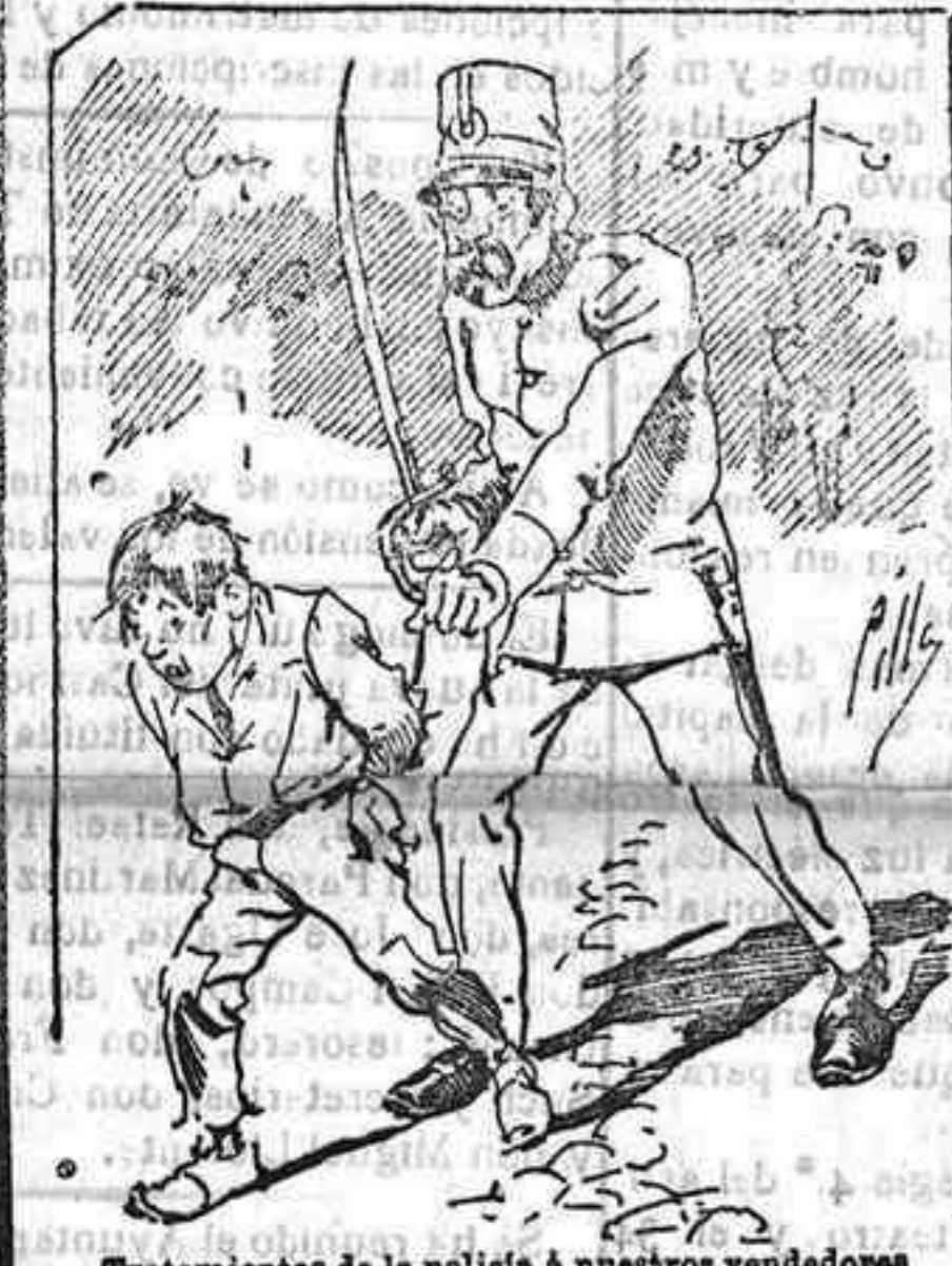
Tratamiento de la polioxa á nuestros vendedores cuando el número pida...