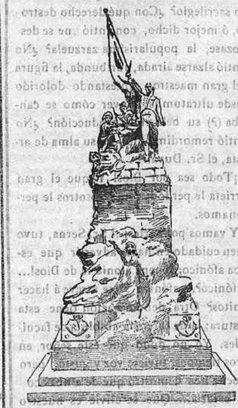
EL MONUMENTO DE SAN PAYO

En el mismo lugar en que los gallegos testimoniaron con torrentes de sangre su heroísmo, inmortalizando el nombre del puente de San Payo, Galicia, ha erigido un monumento que acaba de inaugurarse con motivo del primer centenario de aquel hecho.