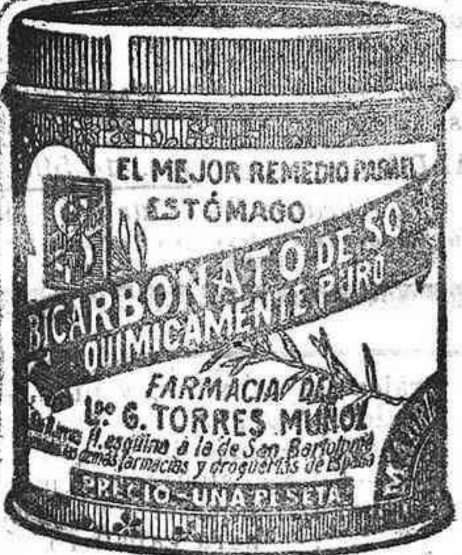
LATAS ECONÓMICAS A 5 PESETAS