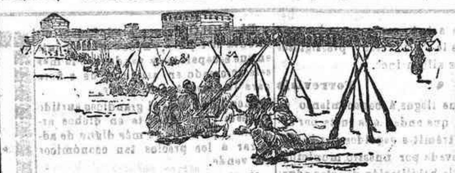
Defensores de la ciudad asediados en el patio del palacio de Muley Hafid