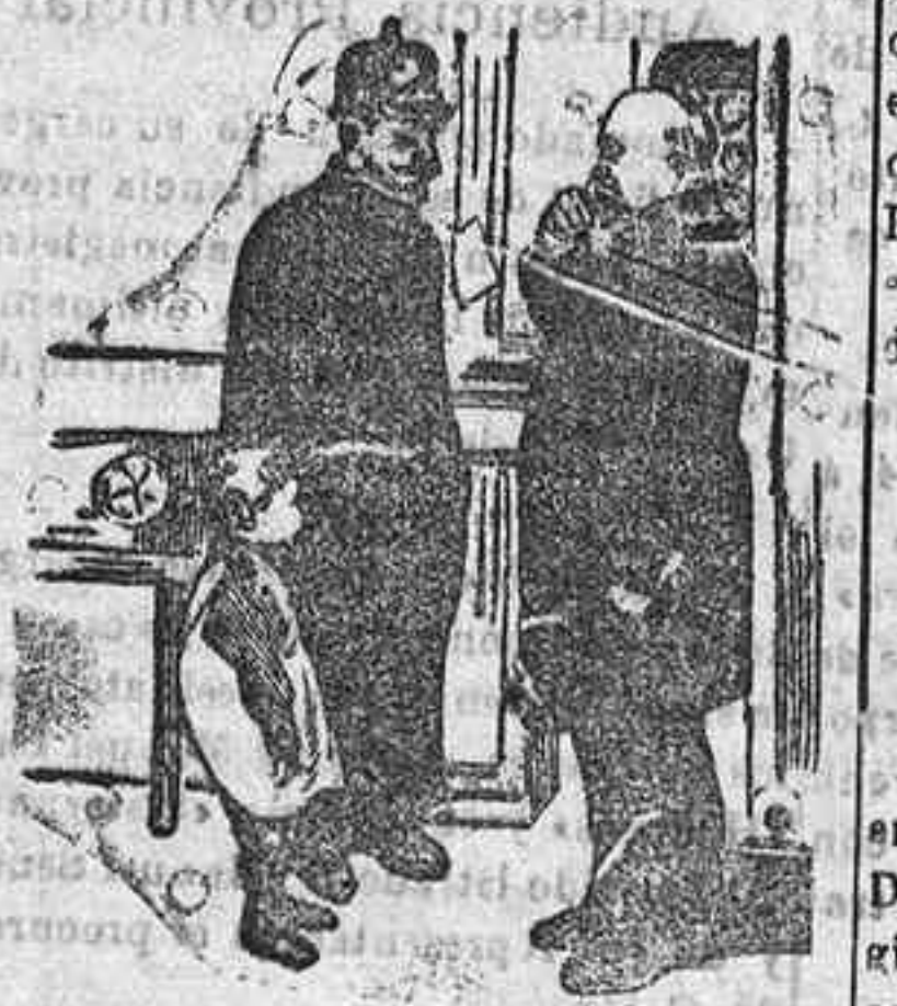
Presentando al jefe de un puesto un niño abandonado.

Otro de los servicios que presta con verdadero interés la policía berlinesa es la recogida de niños perdidos ó abandonados. Nuestro segundo dibujo es una nota gráfica de este servicio. Un agente presenta al brigada un niño de cinco á seis años encontrado en la calle. El jefe del puesto interroga al pequeño infante sobre su domicilio ó parientes para restituirlo á su hogar; cuando no es posible averiguarlo, lo entrega á su superior, quien ordena sea acogido á un asilo hasta que sea reclamado.