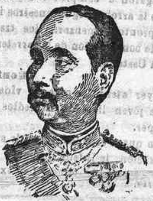
El Rey de Siam

Este monarca de tantos y tan raros nombres, fué un gran admirador de Europa á la que visitó repetidas veces, sin olvidarse de España, de la que fué huésped en dos ó tres ocasiones.