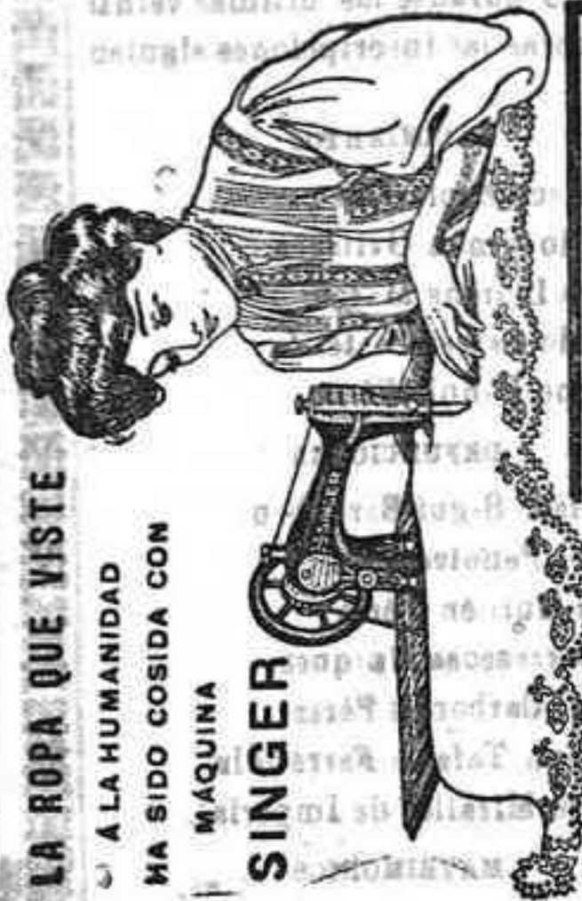
LA ROPA QUE VISTE A LA HUMANIDAD HA SIDO COSIDA CON MAQUINA SINGER