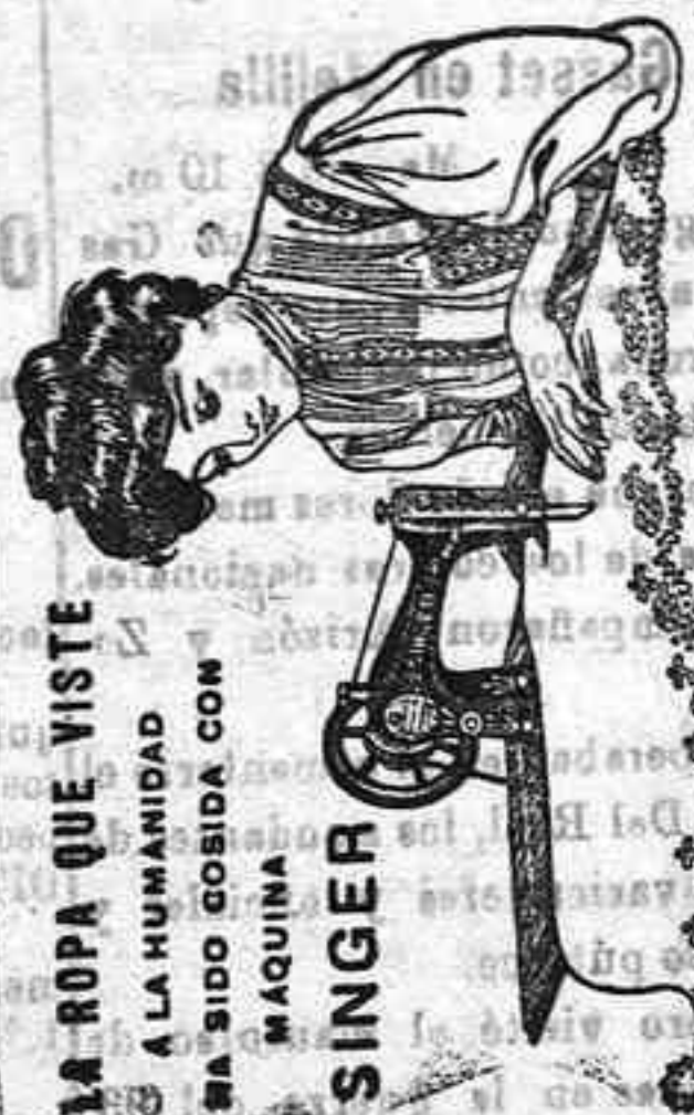
LA ROPA QUE VISTE A LA HUMANIDAD HA SIDO COSIDA CON MAQUINA SINGER

Linea de Liverpool. Linea de Nueva York, Cuba y Méjico. Linea de Venezuela-Colombia. Linea de Canarias. Linea de Tánger. Linea de Cuba y Méjico.