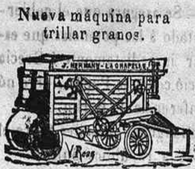
Nueva máquina para trillar granos.

Nuevos molinos de harina sobre zócalo Boffeol de hierro.