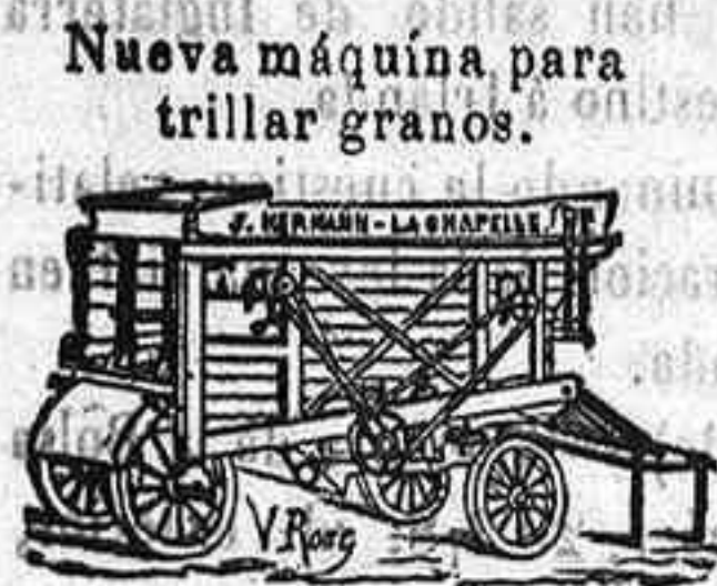
Nueva máquina para trillar granos.

Nuevos molinos de harina sobre zócalo Boffeei de hierro.