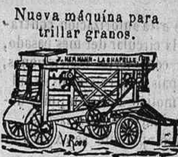
Nueva máquina para trillar granos.

Nuevos molinos de harina sobre zócalo Boffaoli de hierro.