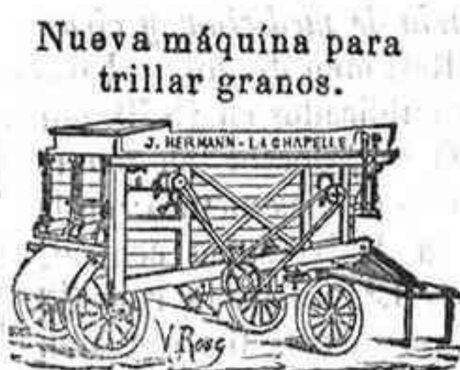
Nueva máquina para trillar granos.

Nuevos molinos de harin sobre zócalo Boffeol de hierro.