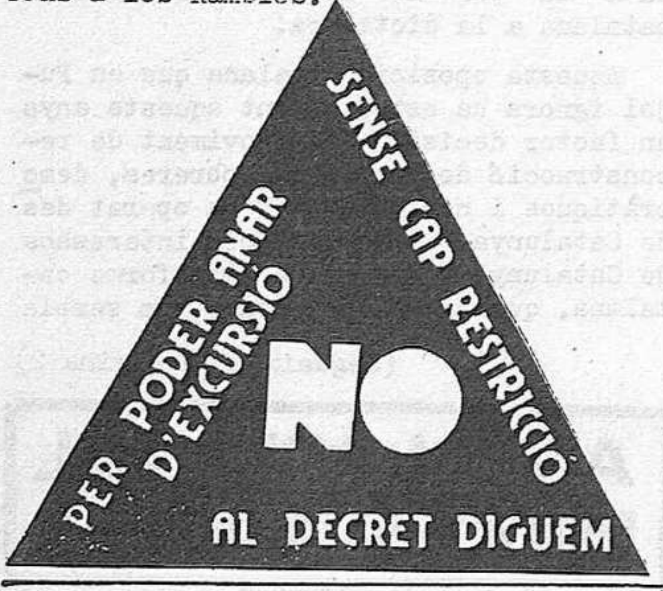
Etiqueta de protesta contra el decret.

El diumenge 26 de gener uns 3.000 joves es van concentrar a la Pl. Sant Jaume de Barcelona per protestar contra el decret d'acampada que denunciàvem al número anterior i que és una autèntica provocació per les mides de control ideològic i burocràtic que el feixisme pretén imposar. Després de cantar cançons i cridar contra el decret, van marxar fins a les Rambles.