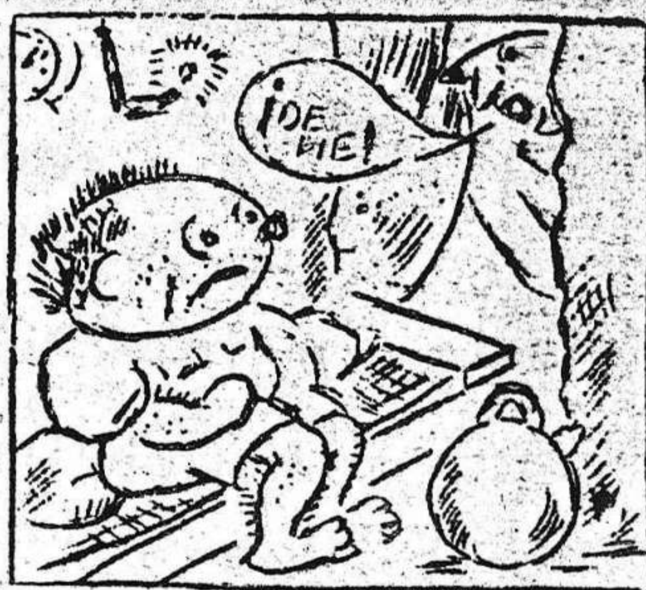
3. Lo despiertan de repente, diciendo: ¡Vamos al frente!

Ametralladoras, que cuando el enemigo atacaba desesperadamente nuestras posiciones, como siempre en tu puesto fuiste herido de gravedad de una bala traidora; nosotros que sabemos cuanto vales porque fuiste el primero dejando de ser analfabeto; fuiste el primero en la capacitación y en la vigilancia, instruyéndote siendo un buen soldado que conviviste con los camaradas internacionales como un verdadero hermano de lucha y trabajo.