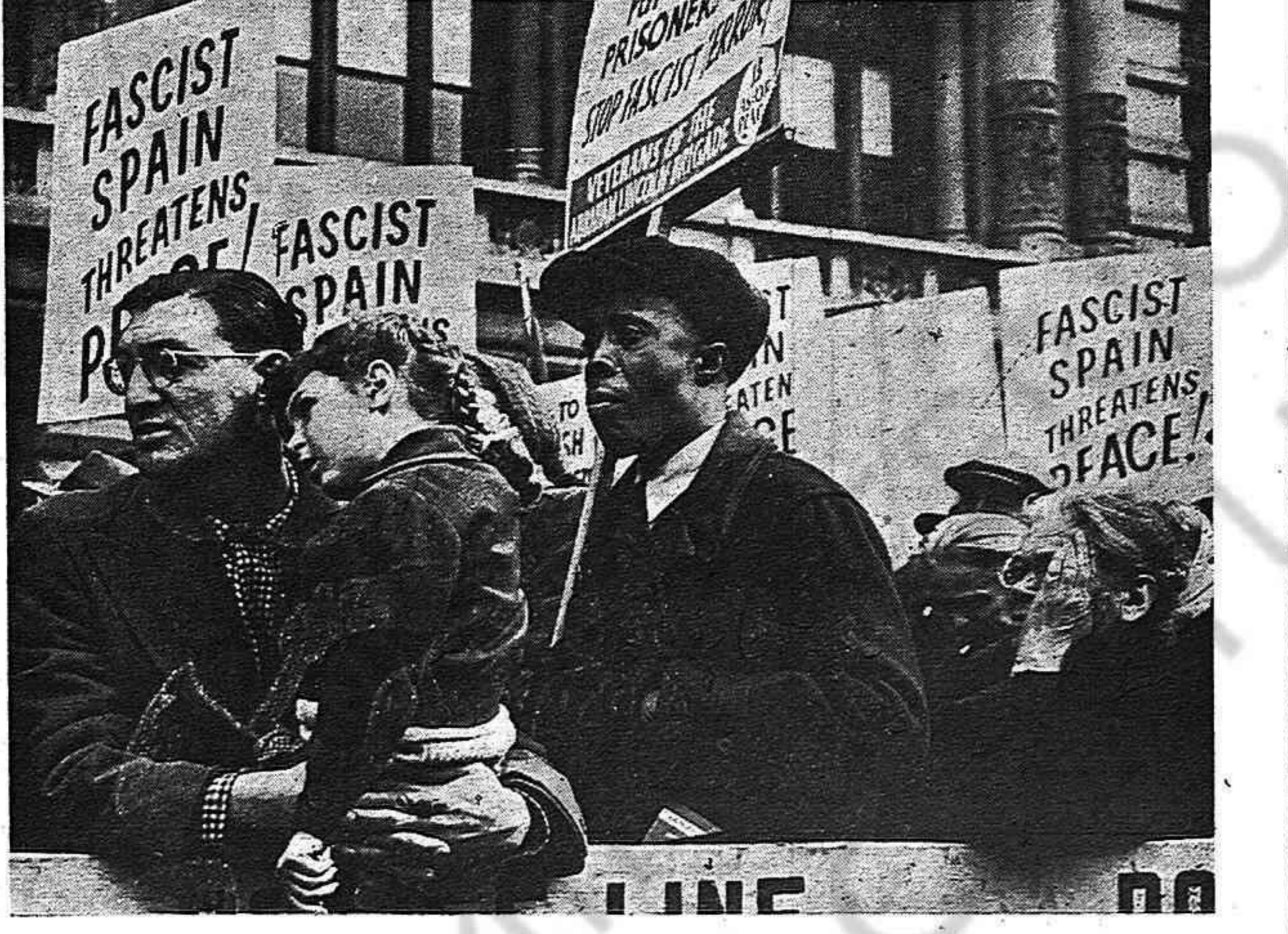
Una expresiva foto tomada en el gran acto celebrado en Nueva York, cuya reseña aparece en este mismo número, en favor de la República española. Hombres y mujeres de Estados Unidos reclaman, en abrumadora mayoría, la ruptura de relaciones con el franquismo, régimen fascista y amenazador de la paz.