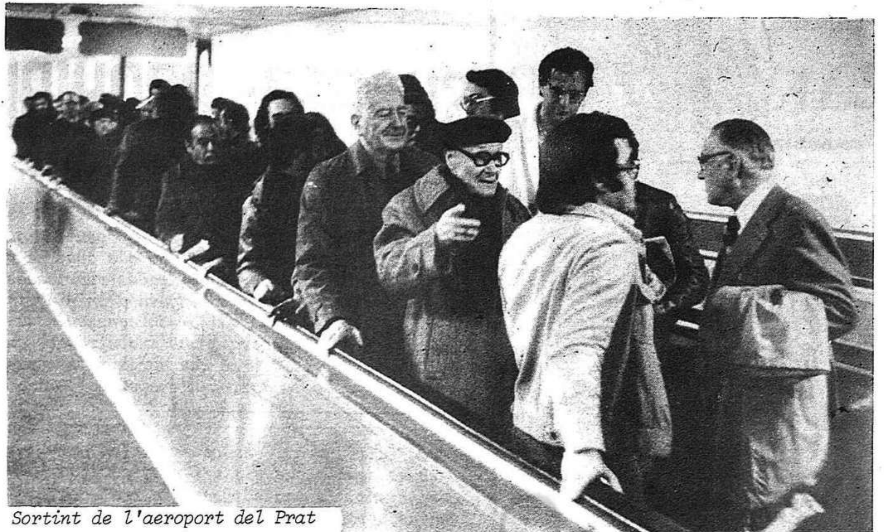
Sortint de l'aeroport del Prat