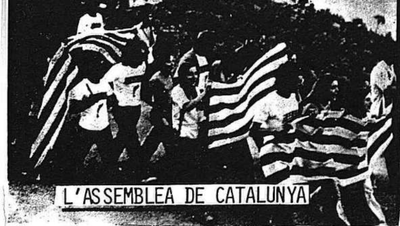
L'ASSEMBLEA DE CATALUNYA