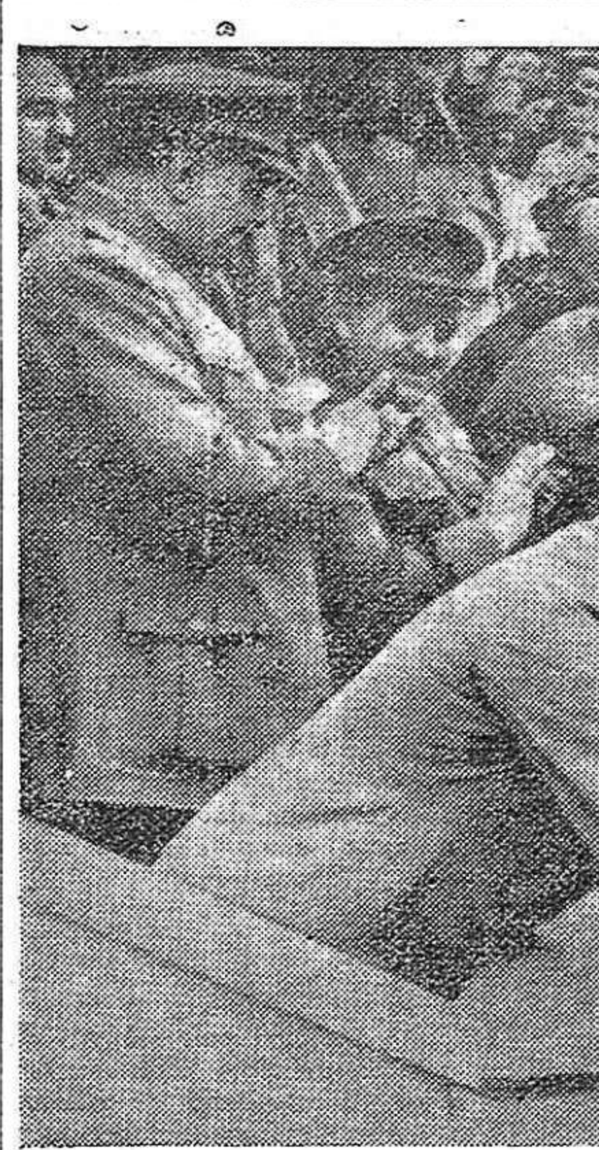
LA DIADA DELS ESPORTS A MOSCÚ. A la dreta: Un aspecte de la desfilsa a l'Estatí Dnyamo. A l'esquerra: El generalíssim Stalin rep l'homatge de dos petits ciutadans soviètics.

Es la conclusió que volem treure d'aquest comentari sobre alguns aspectes de l'actual situació econòmica a la Gran Bretanya.