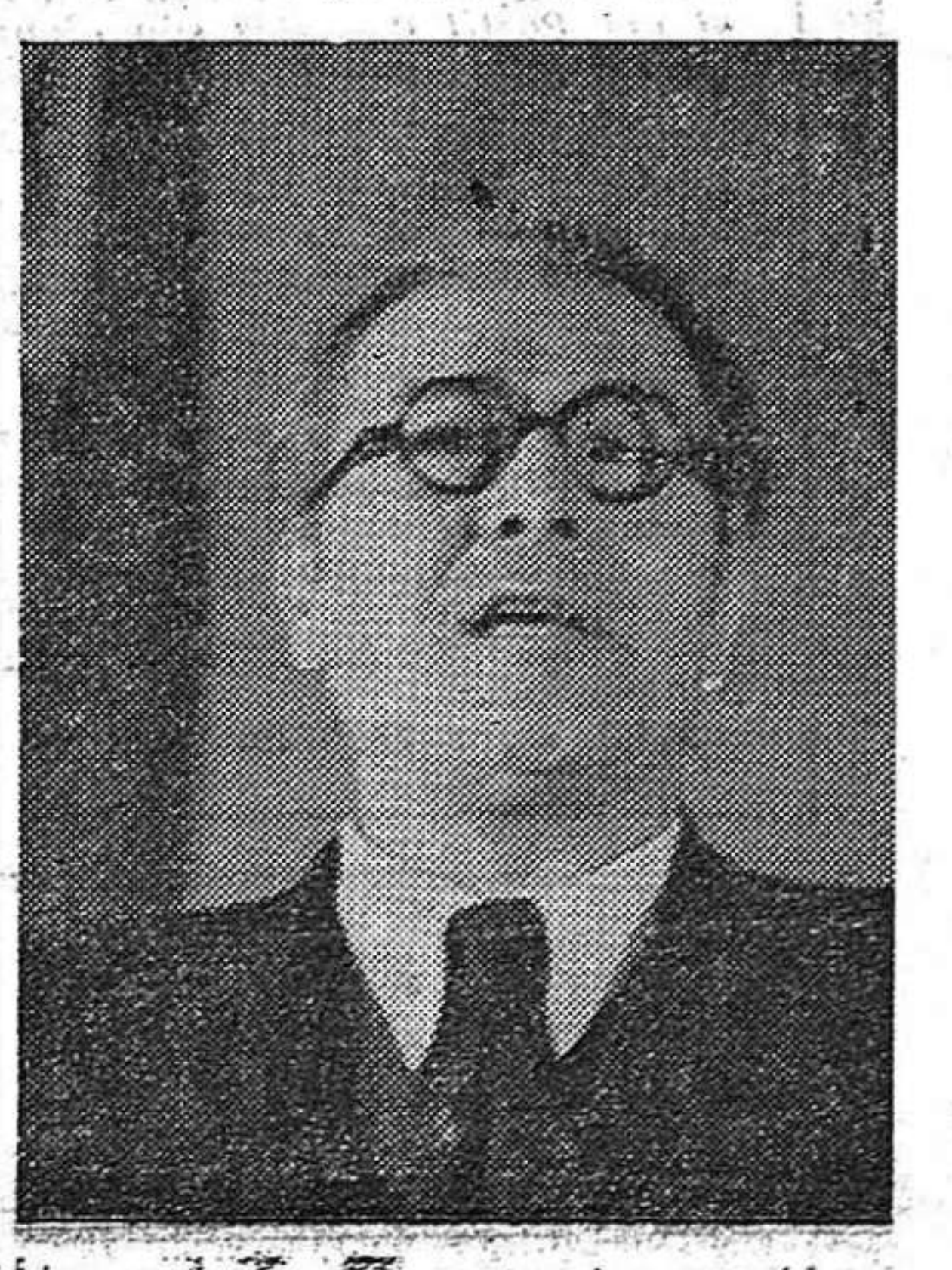
riosa realitat, una incommutable força homogènia, bolxevic, leninista-stalinista. El P.S.U. de C. està de ple en l'estapa de les grans realitzacions nacionals, perquè ja és l'autèntic Partit nacional de Catalunya.»

marcar-los en una conferència pronunciada a Mèxic en dir: «Totes dues experiències (la de Catalunya i la de l'emigració) camaren, demostren que el P.S.U. de C. és ja un objectiu assolit; que el P.S.U. de C. no és ja un assaig sinó una glo-