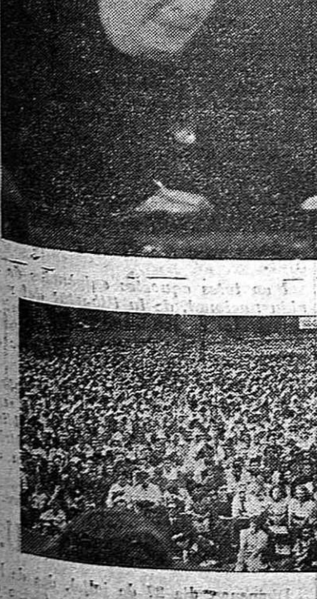
Un aspecte de la gran concentració de Tolosa

Visca el P.S.U. de C.! Visca Catalunya! Visca la República!