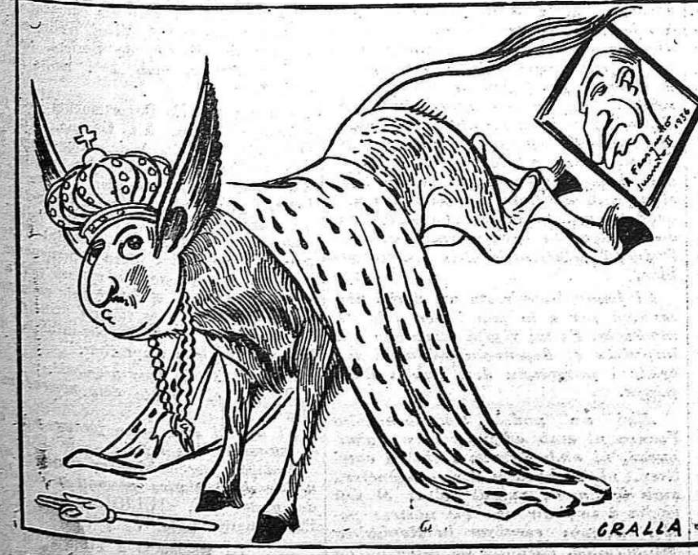
“EL CAUDILLO”, primer de la seva dinastia