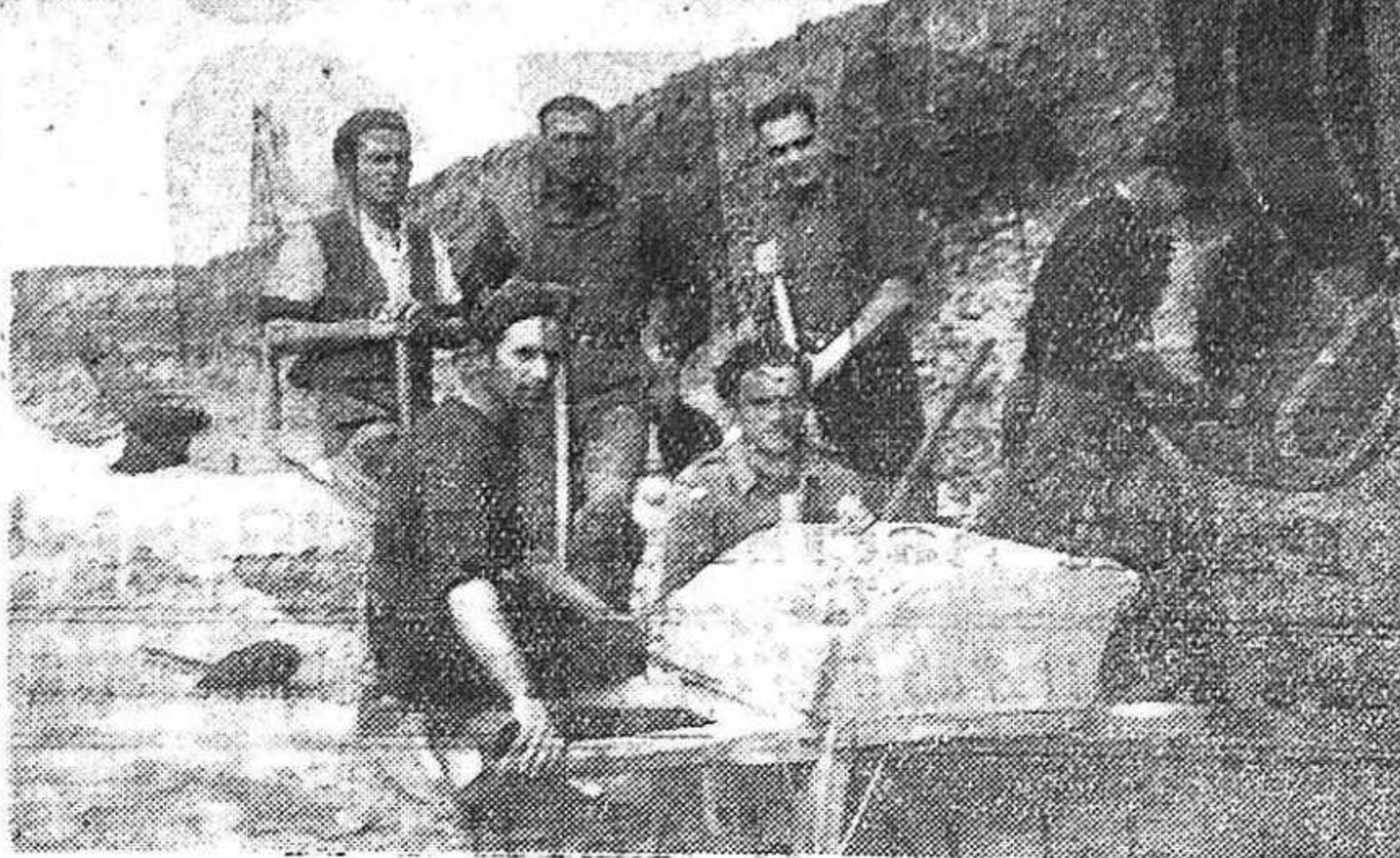
BRAM — Grup de companys del nostre Partit i del P. C. d'Espanya que han realitzat «jornades roges» per tal d'ajudar la resistència interior