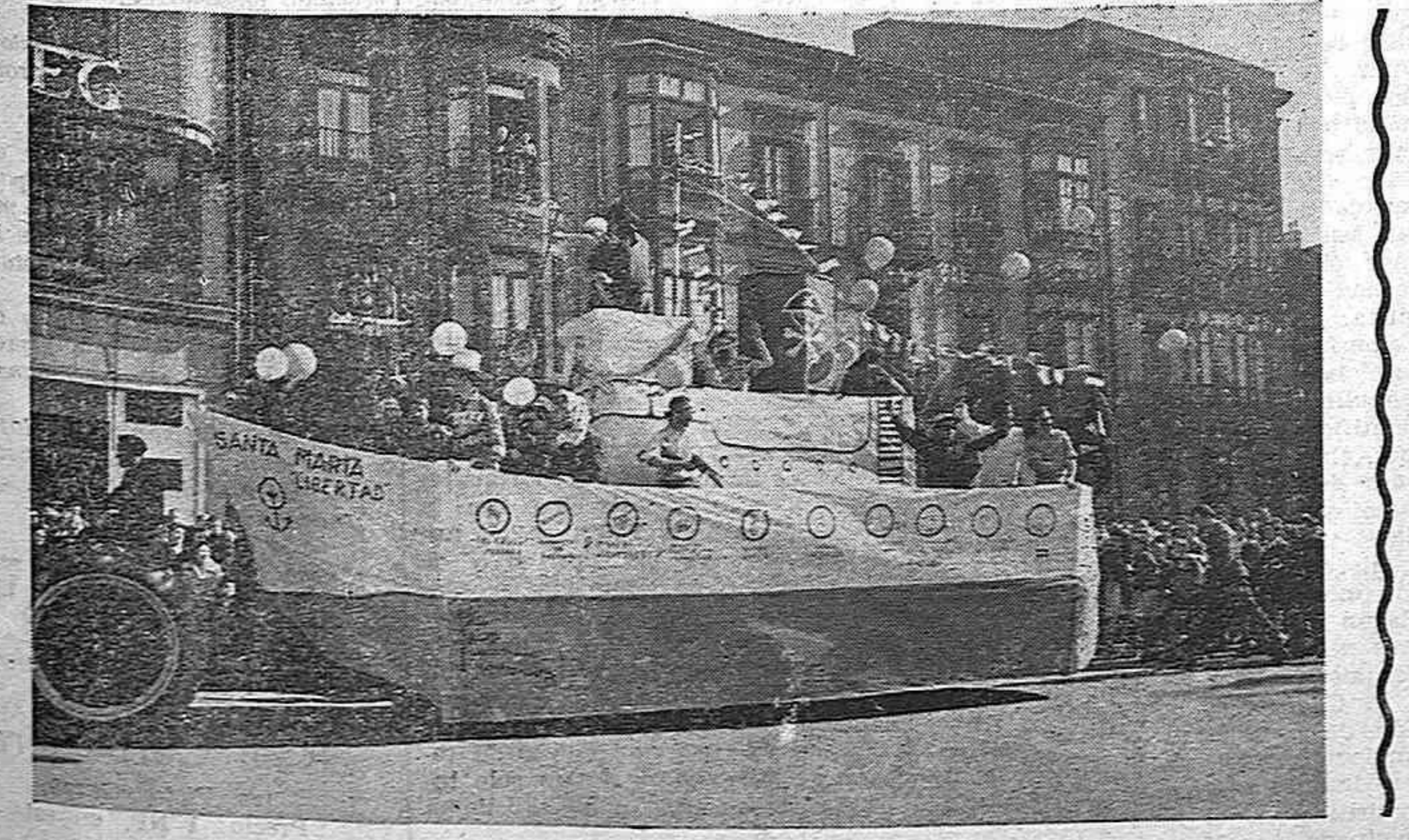
6-5-60, en Gijón. Carroza alumna al «Sta. María» en la fiesta de los Peritos Industriales.

El lugar está bien escogido tanto por la panorámica como por las excursiones a lugares vecinos. Incluso el mar no está lejos ni los pueblos para aprovisionarse. El «camping» estará abierto del 1 al 31 de agosto, esperándose que será extraordinariamente concurrido por compañeros de todos los países para reafirmar la hermandad internacional libertaria.