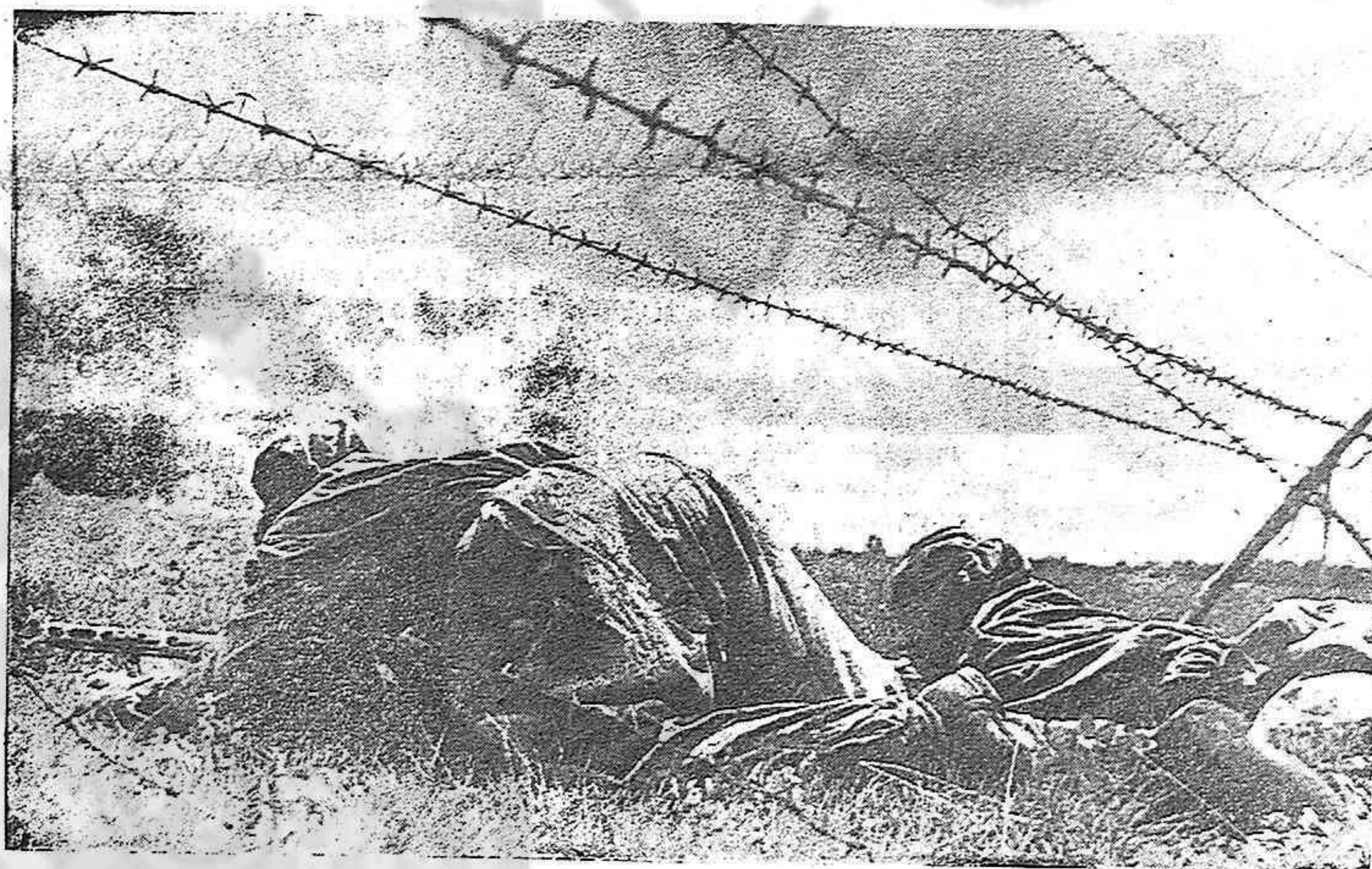
Acción de guerra en el Frente Oriental.