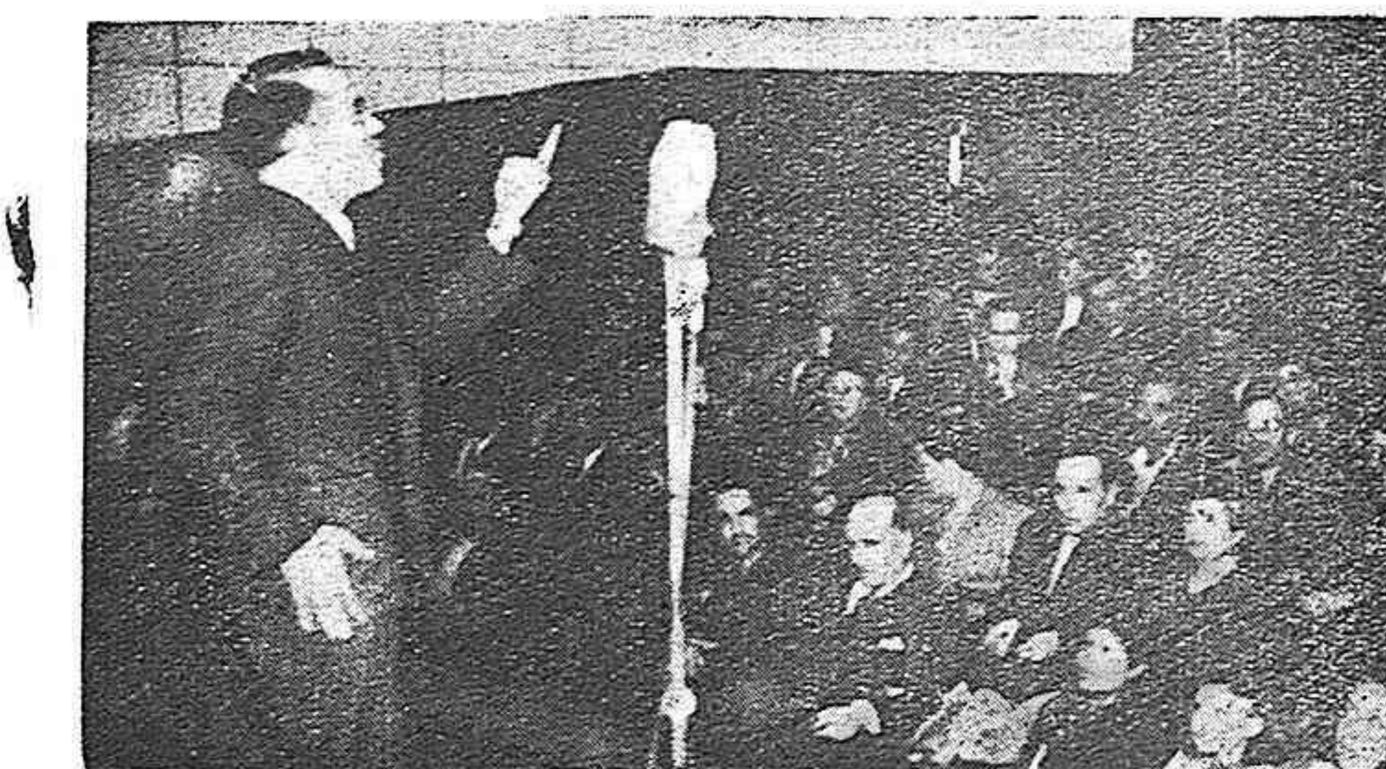
Intervención en el acto de homenaje a Stalingrado.

Finalmente, nosotros que hace solamente semanas sufríamos la vida terrible bajo el franquismo, sabemos el valor que tiene para todos los que allí viven, sufren y luchan, el esfuerzo solidario de América, y por eso estimamos en todo su ejemplar valor la actividad magnífica que desarrollan el Patronato de Ayuda al Pueblo español y las entidades que colabo-