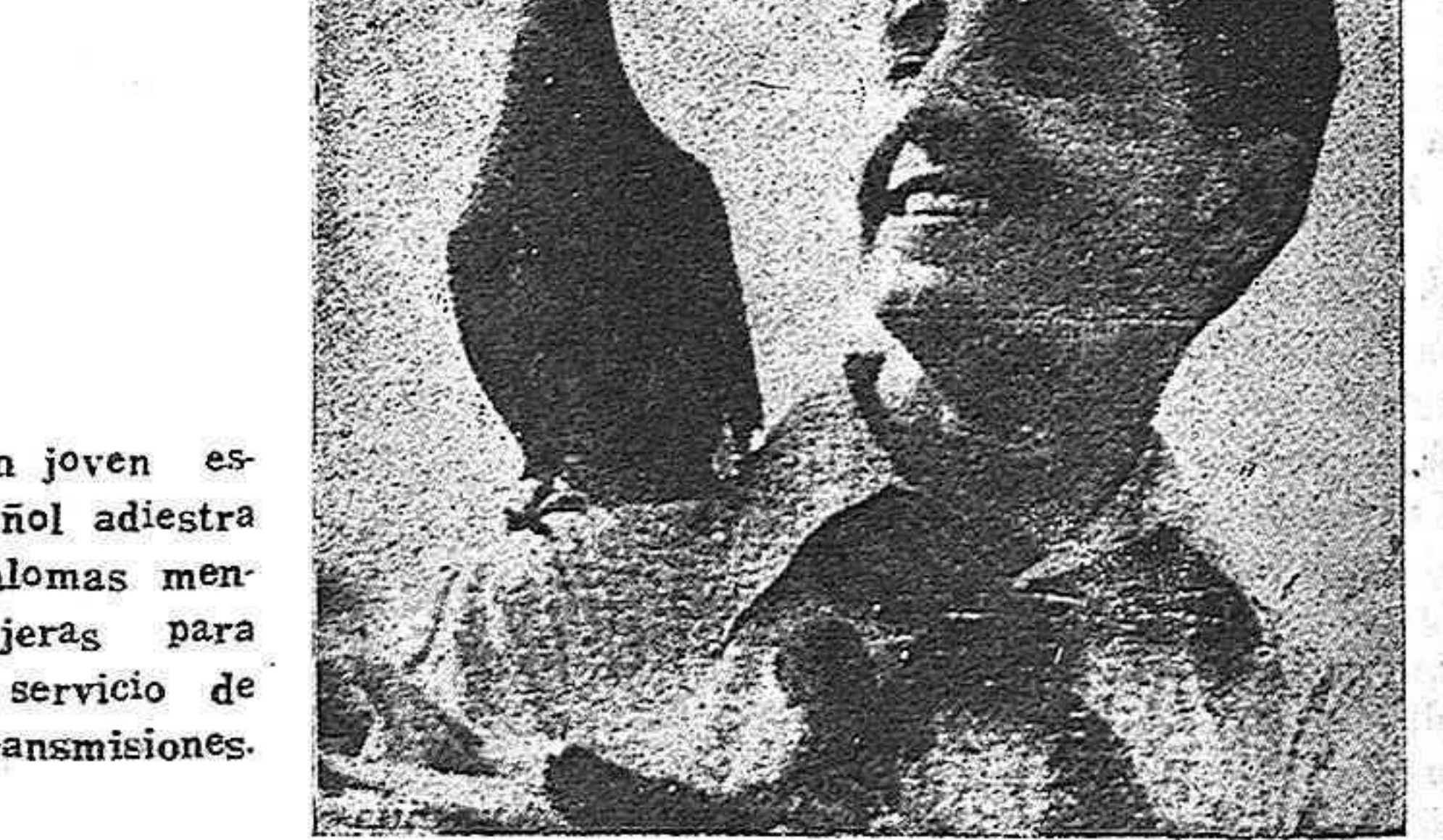
Un joven español adiestra palomas mensajeras para el servicio de transmisiones.