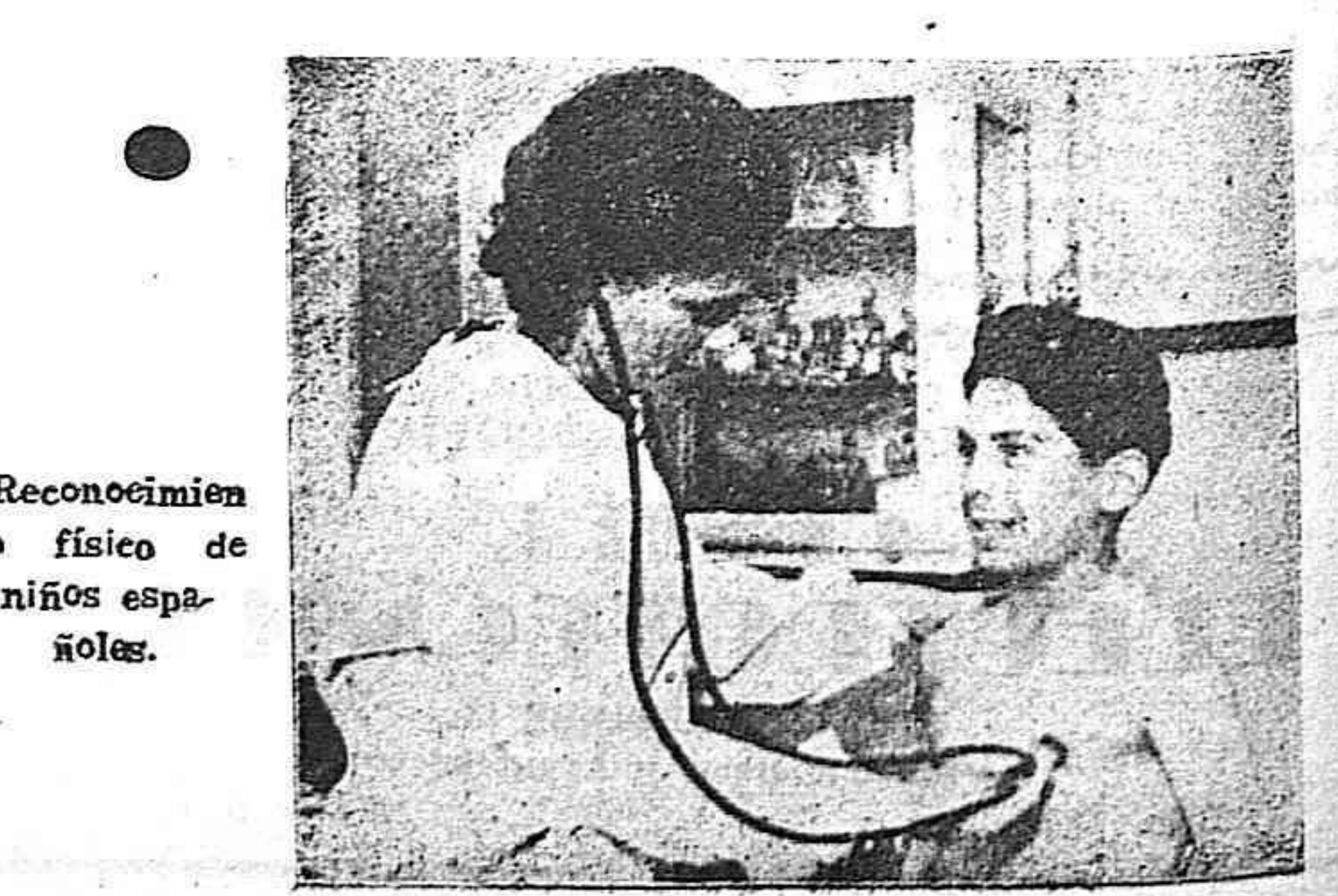
Reconocimiento físico de niños españoles.