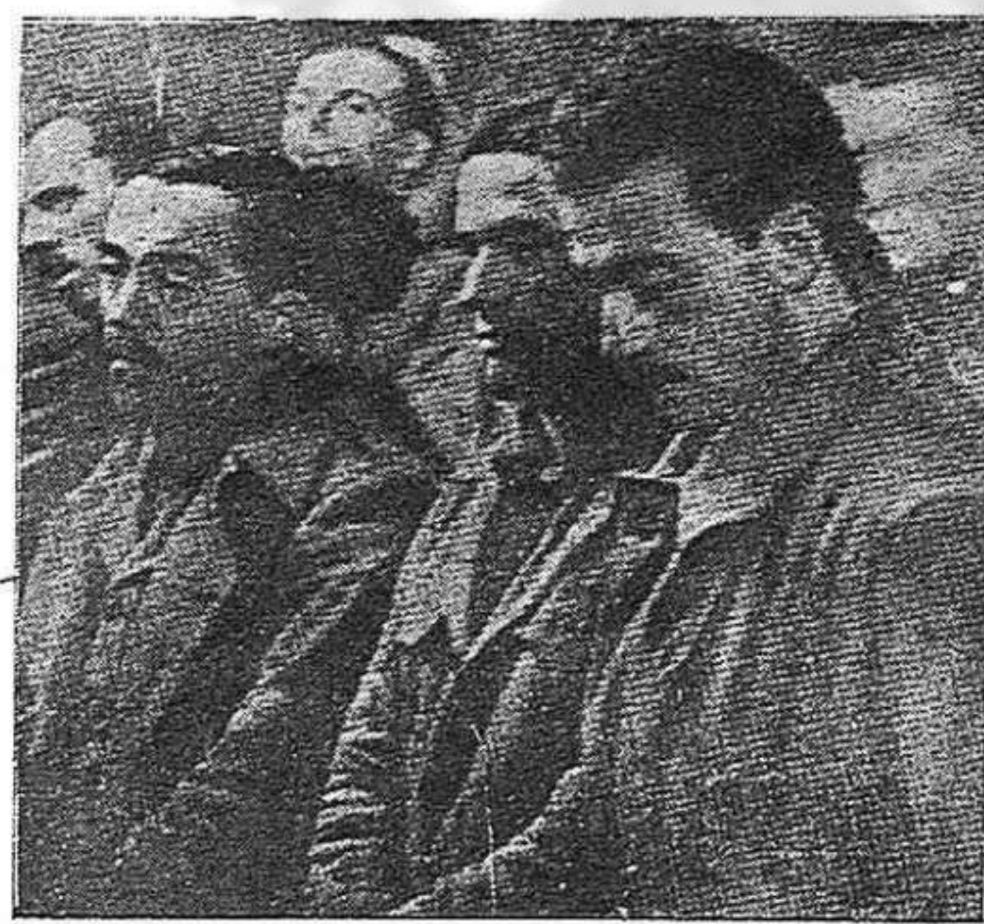
Prisioneros italianos hechos en Guadalajara por el Ejército Popular español.

La lucha heroica de Guadalajara y de toda la guerra contra los invasores por la independencia de España, prosigue hoy con otras formas, pero con ardiente ímpetu, en las nuevas condiciones de nuestro país, cuando España entera se halla sojuzgada por la tiranía franquista, su independencia, enfeudada a alemanes e italianos y su territorio sometido al dominio de los países invasores. (Pasa a la pág. 4)