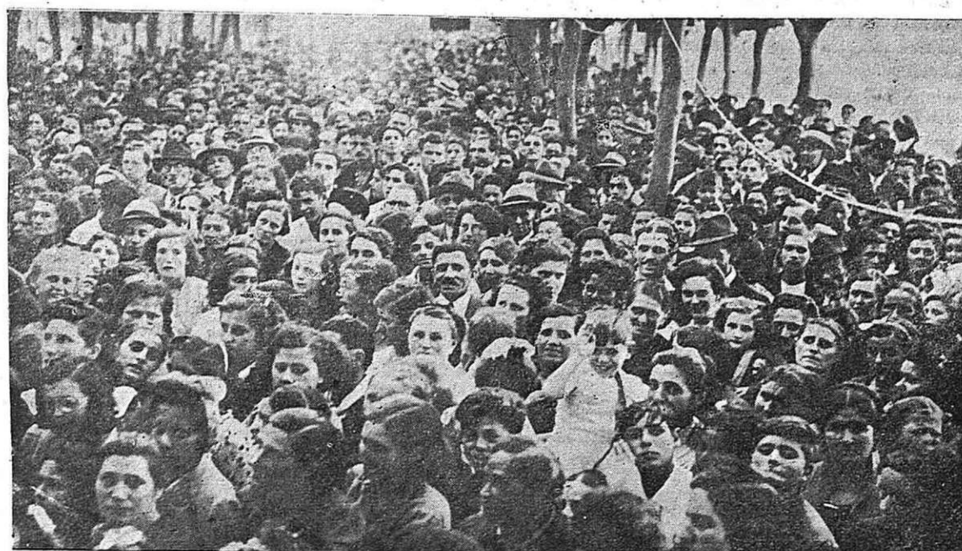
Un acto del Frente Popular español en Montevideo.

En el local de la UGT, Madrid 74, continúan recibiendo adhesiones que publicaremos en nuestros números sucesivos.