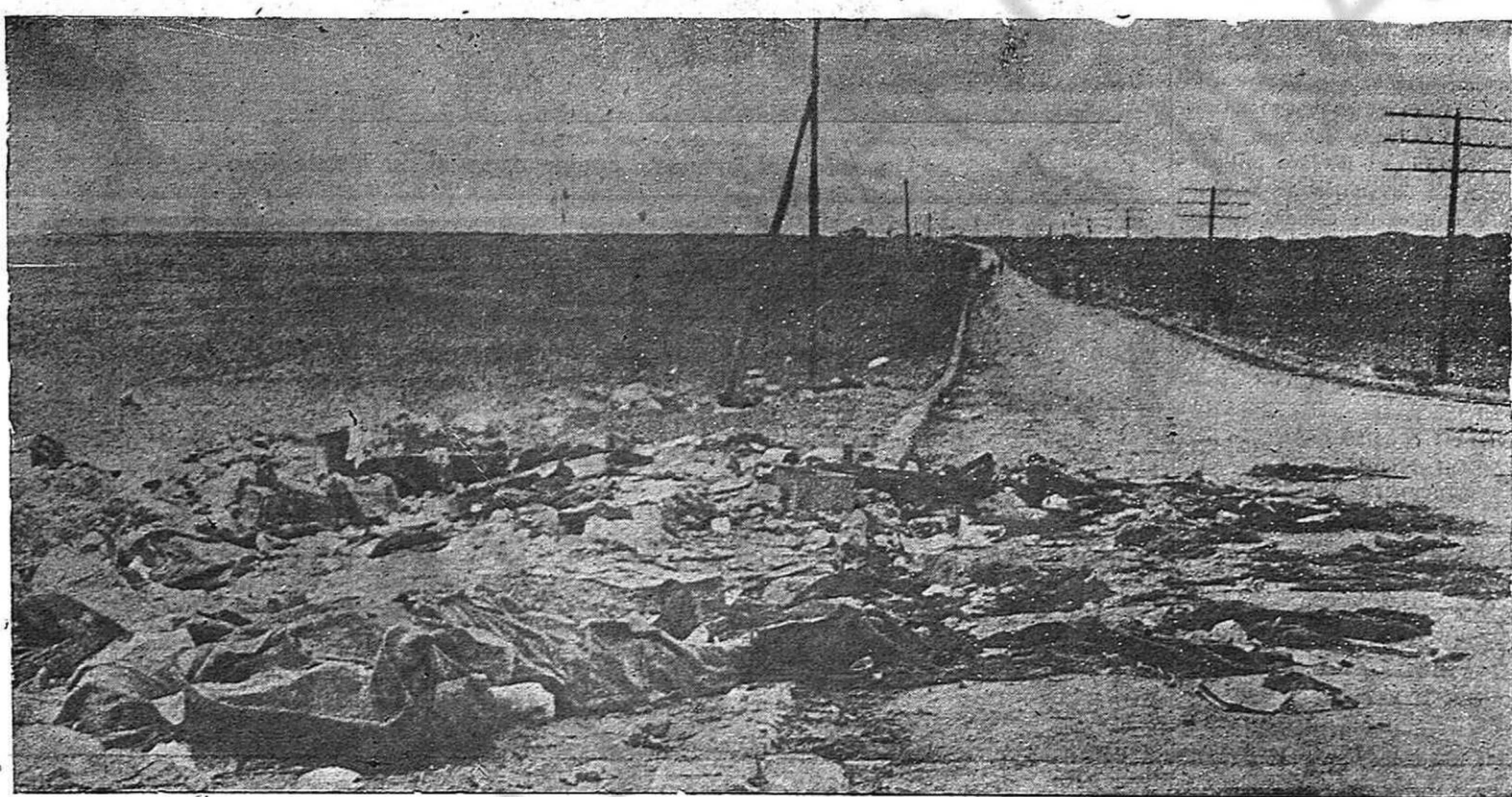
La barretera de Aragón en los campos de Guadalajara, después de la retirada de los italianos