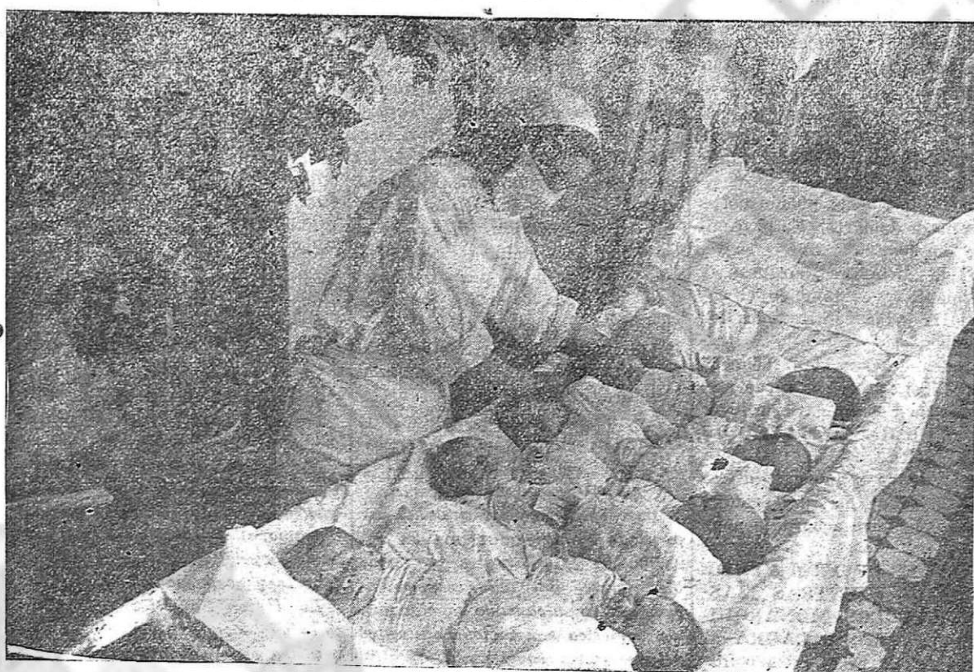
Mientras en el mundo capitalista hay millones de niños abandonados a la miseria; mientras la guerra imperialista siega diariamente muchos millares de vidas infantiles, en la Unión Soviética la infancia es objeto de los más diligentes cuidados, como en la magnífica Casa-cuna que reproduce este grabado, ejemplo de las muchísimas similares que existen en el País del Socialismo.