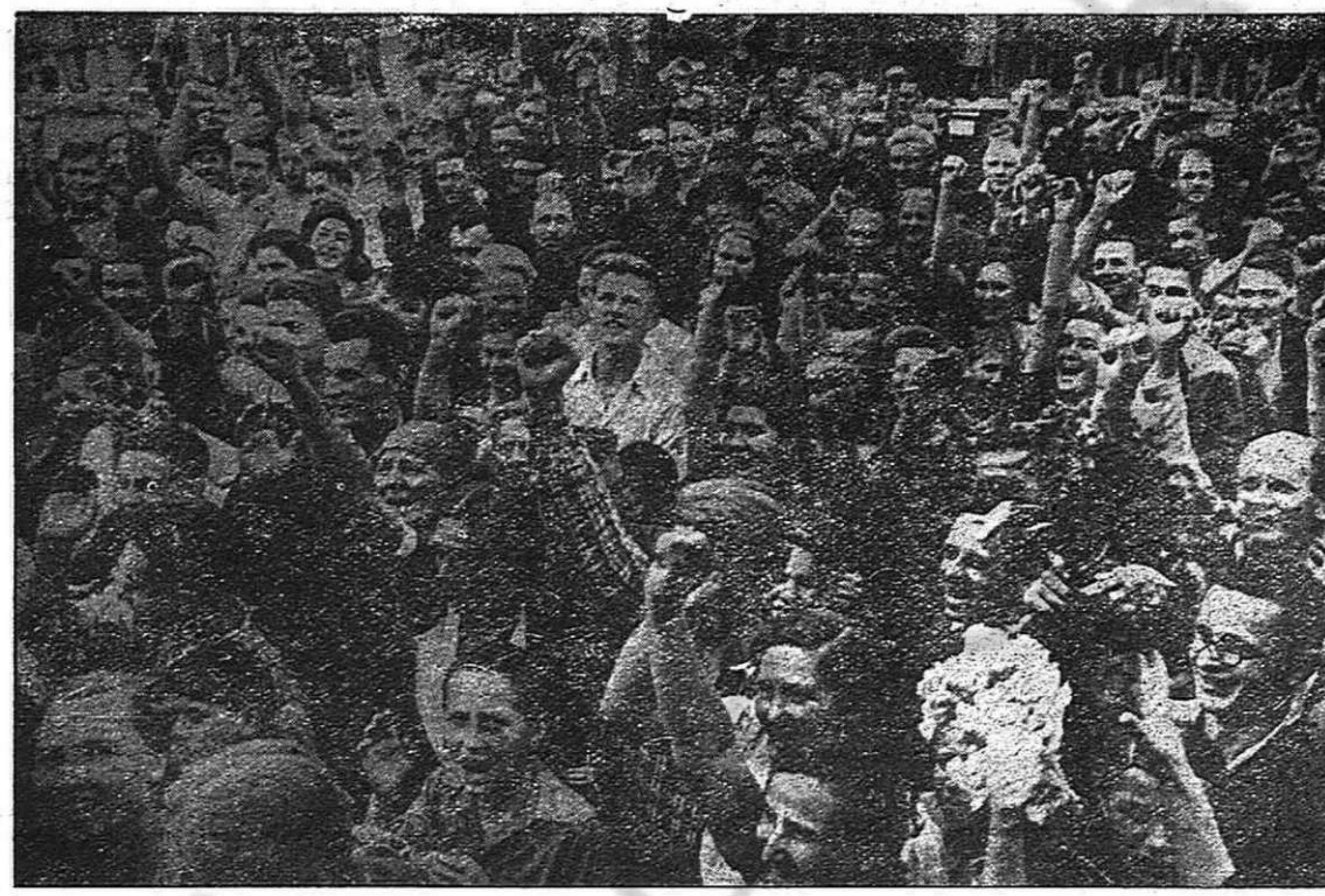
¿Qué otro ejército en el mundo es recibido con el grandioso entusiasmo con que el pueblo letón saluda la llegada del Ejército Rojo? Los ejércitos imperialistas llevan a los pueblos el hambre, la miseria y la muerte. El Ejército Rojo les lleva la liberación y la felicidad socialista. Esta es la diferencia.

quiere para que sirva de testigo. La mujer contesta: "No se moleste. Yo no voy de testigo. Aunque estoy aquí, para usted como si no estuviera". Y dirigiéndose a su convencia le dice: "Tendrás que entregarle los bueyes y la casa para ver si revienta de una vez con su riqueza".