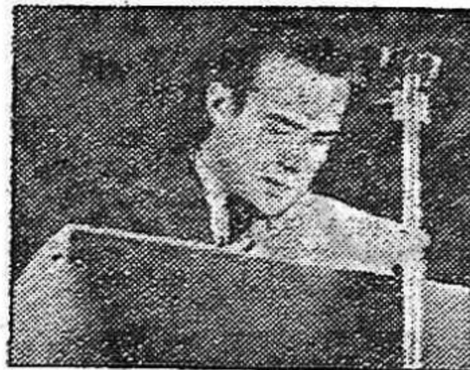
ABELLA, antiguo joven libertario dice:

¡Viva la promoción «7 de Noviembre»! ¡Viva la J.S.U.!»