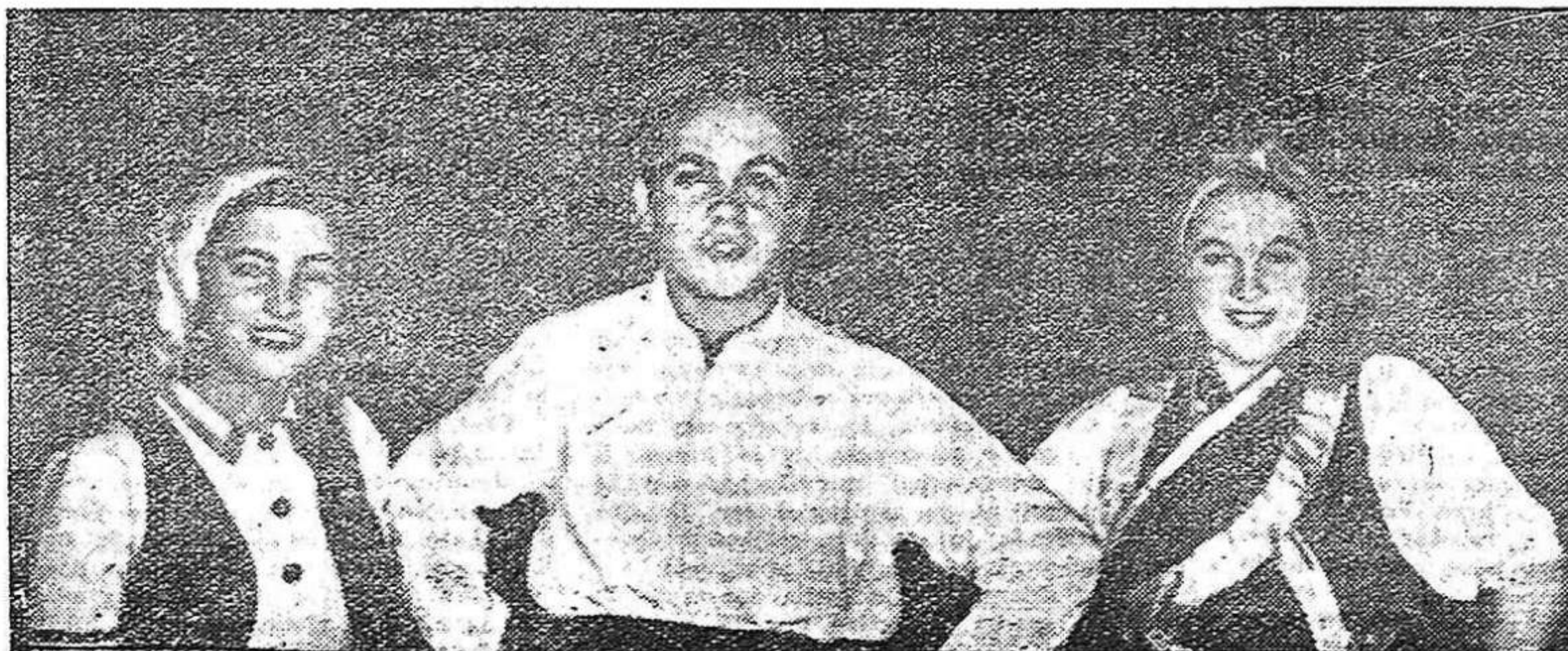
Jóvenes de la promoción «7 de Noviembre» en uno de los festivales, vestidos con trajes regionales

EN UNO DE LOS FESTIVALES DE LA CONFERENCIA