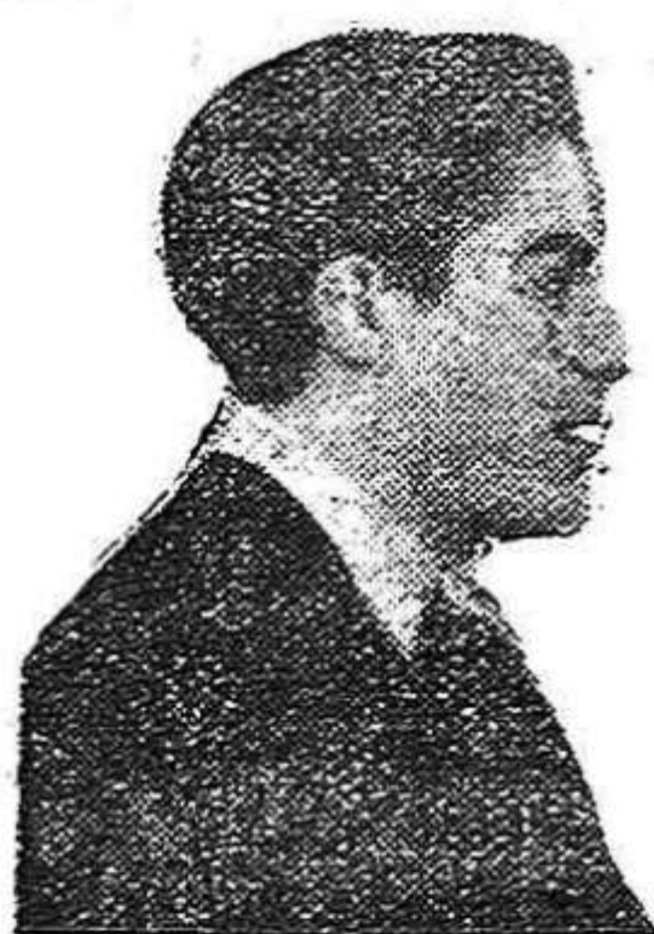
Para ser un buen guerrillero hay que ser de la J. S. U.

«Camaradas: He ingresado en la J.S.U. porque he visto cómo luchan los jóvenes socialistas unificados en guerrilleros; porque he comprendido que donde hay un J.S.U. hay un amigo, hay un camarada. Si los jóvenes emigrados económicos somos pobres en política, tened la seguridad que amamos mucho a España. Si hoy no hay muchos jóvenes emigrados en la J.S.U., estad seguros que después de esta magnífica Conferencia habrán muchos que responderán a nuestra llamada.»