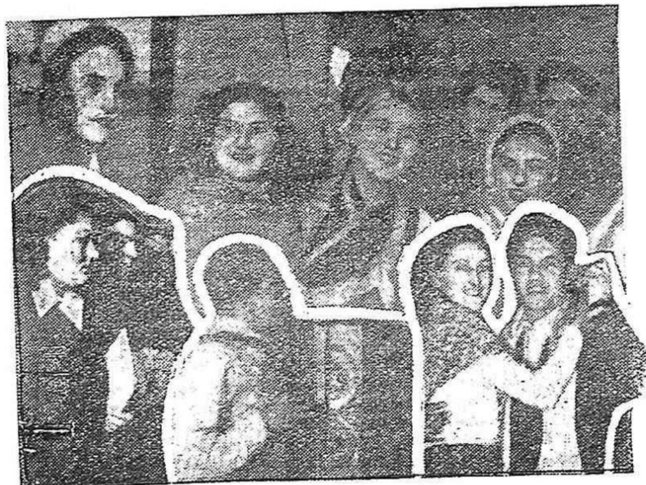
Diversos aspectos de uno de los festivales de la Conferencia

Después de la sesión del viernes por la tarde, celebróse un concurso de danzas y canciones, primero de los intermedios artísticos y recreativos que fueron intercalados en el programa de la Conferencia y que contribuyeron a darle una brillantez y un carácter auténticamente juvenil sin precedente en los anales de la emigración española.