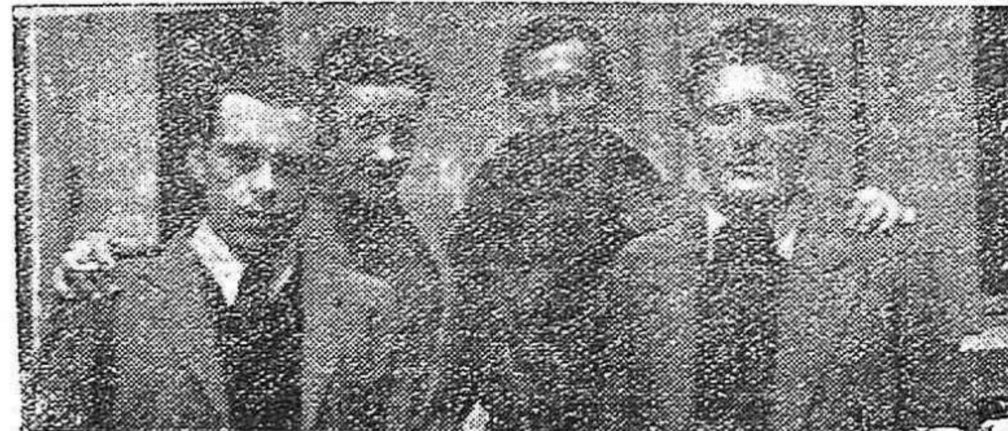
Grupo de guerrilleros al final de una de las sesiones de la Conferencia

«Queremos — dijo — una Universidad abierta de par en par a la juventud. Y unos estudiantes que fraternamente unidos a toda la juventud de España, avancen, alegre y audazmente, a la conquista del futuro.»