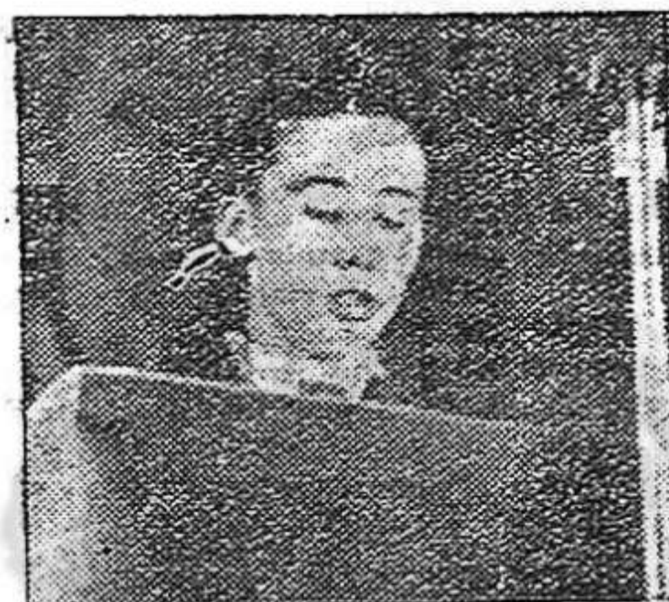
Ingreso en la J. S. U. porque siento la llamada de la Patria.

«Camaradas de la J.S.U.: Antigua militante de las Juventudes Libertarias, en estos momentos tan difíciles para nuestro pueblo y su juventud, me adhiero a la J.S.U., dispuesta a no regatear ningún esfuerzo para luchar por liberar a España y dar a nuestro pueblo la República tan esperada.»