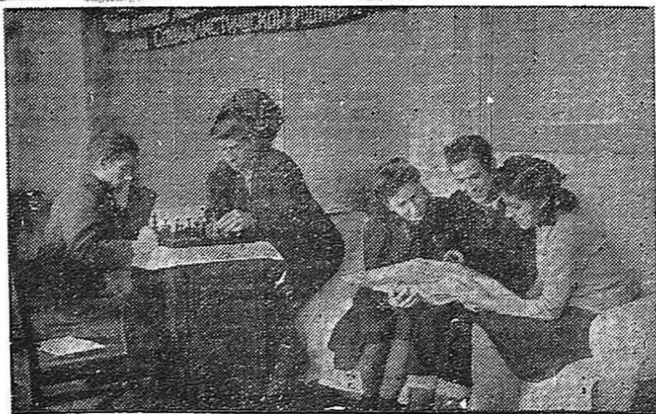
Innumerables adhesiones a nuestra Conferencia se han recibido de los jóvenes españoles que se encuentran en la U.R.S.S. He aquí uno de los grupos de jóvenes que estudian en Moscú.

Cuando los nuevos militantes suben, uno a uno, a recoger su carnet la sala resuena otra vez de entusiastas ovaciones. Muchachos y muchachas llenan la tribuna, y mientras la sala estalla de aplausos entusiastas y vitores juveniles, se adelantan a recibir con el carnet nuevo en la mano, el saludo cordial y efusivo de Santiago Carrillo.