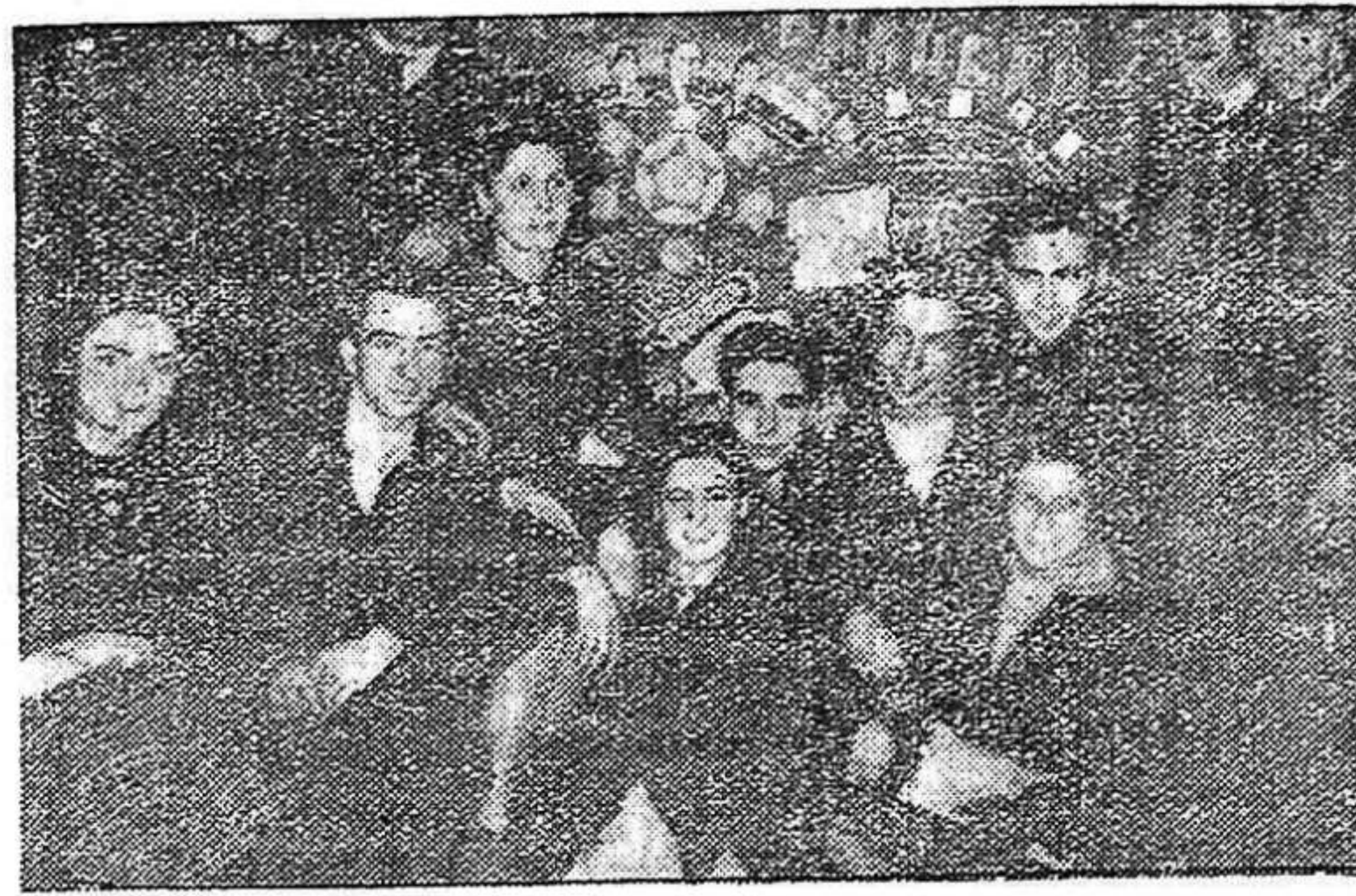
Un grupo de jóvenes junto al periódico mural del Alto Garona que fue premiado por la Conferencia

De los innumerables murales que llenaban la sala, la mayoría han llamado la atención de los asistentes, unos por su magnífico contenido de actividades realizadas, como «La Voz de la Loire», «J.S.U.», del Arège; «Juventud Progresiva», del Club Vitini, de Sauveterre, etc. Otros, por su confección simpática y amena,