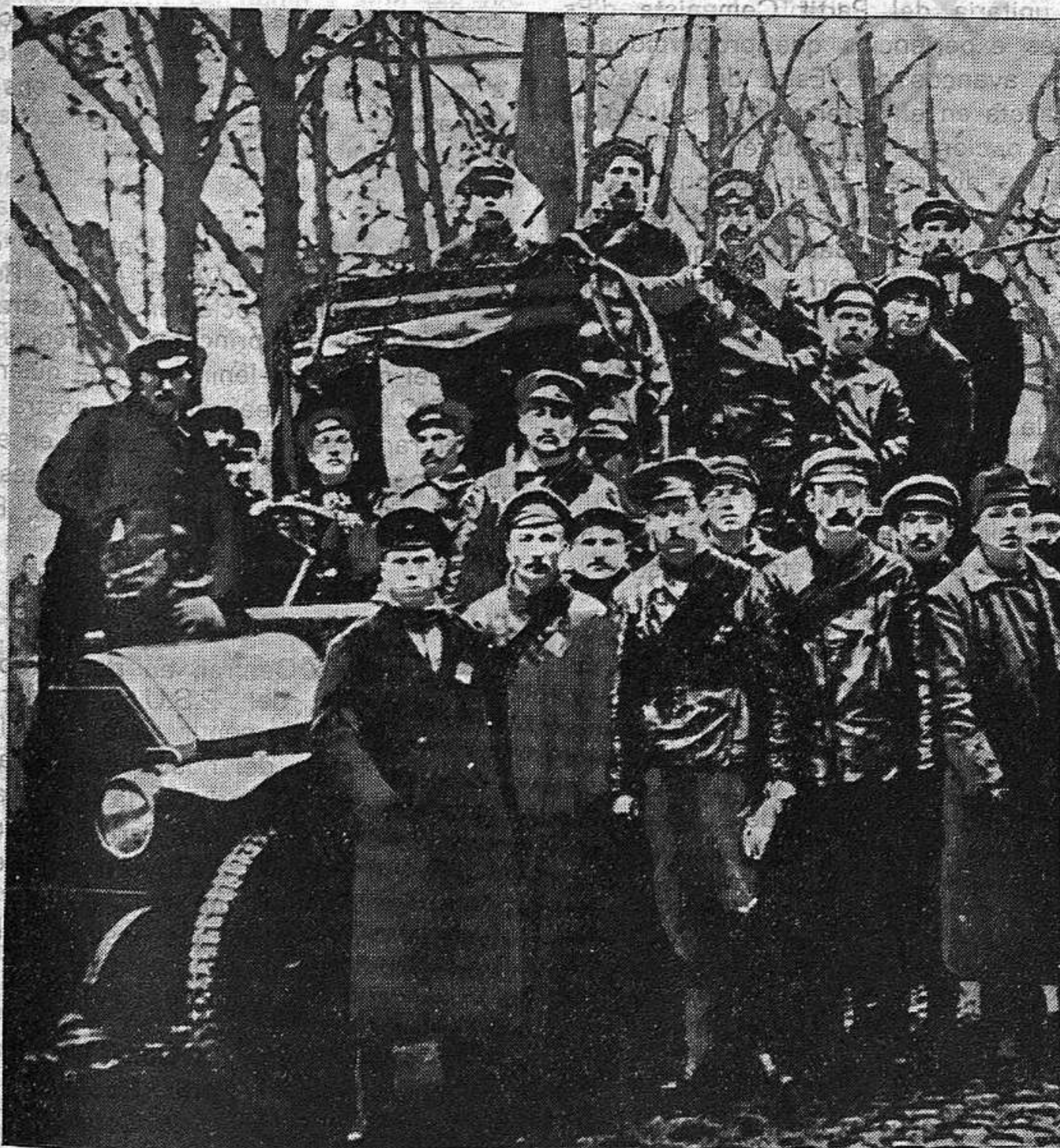
Guardies rojos i obrers durant les jornades d'Octubre.

L A Revolució d'Octubre i els cinquanta anys de desenvolupament de la Unió Soviètica han demostrat que solament el Socialisme pot donar adequada solució als