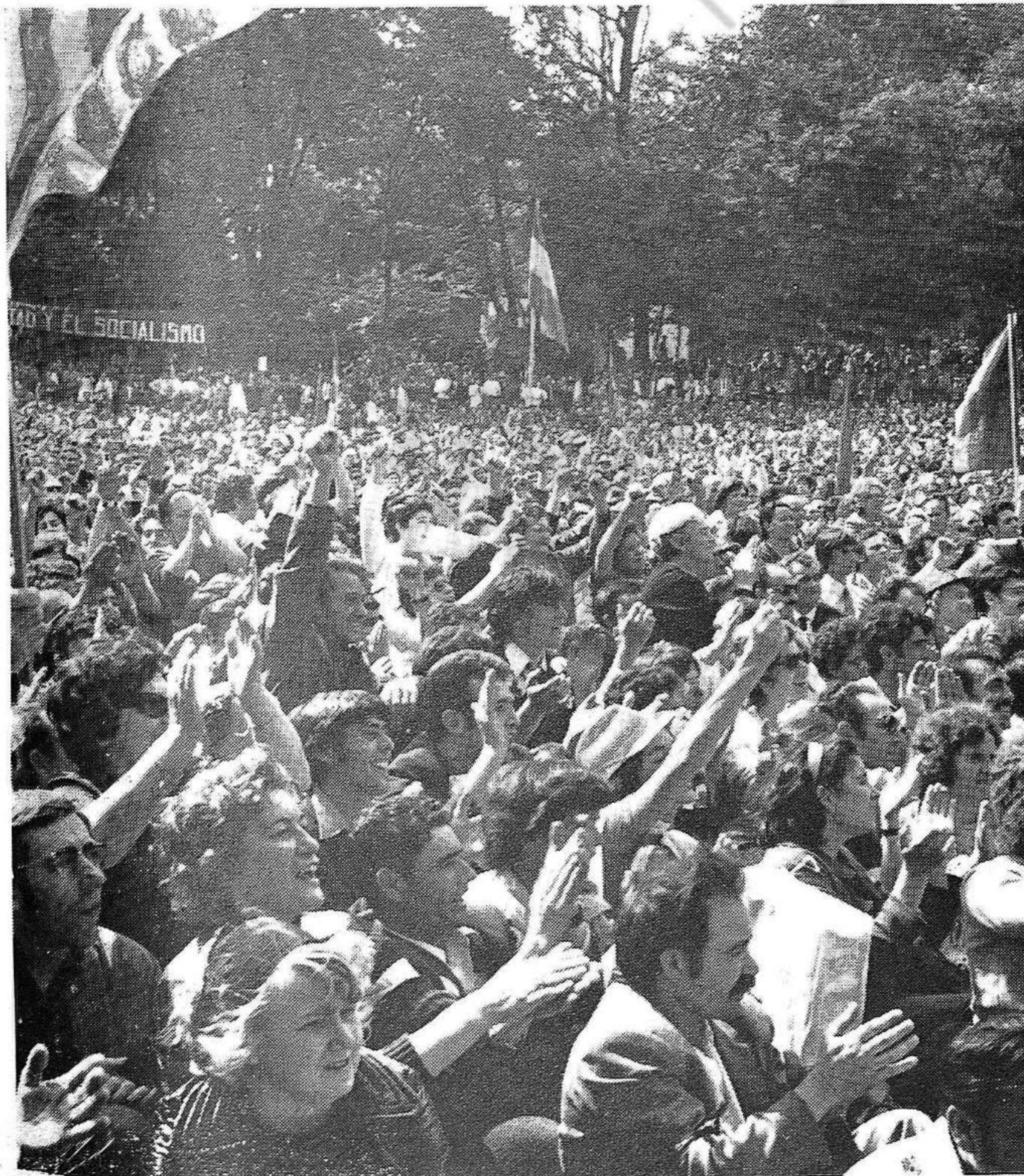
La multitud al Parc de Montreau

(Del missatge del Comitè de Barcelona del P.S.U.C. al míting de Montreau.)