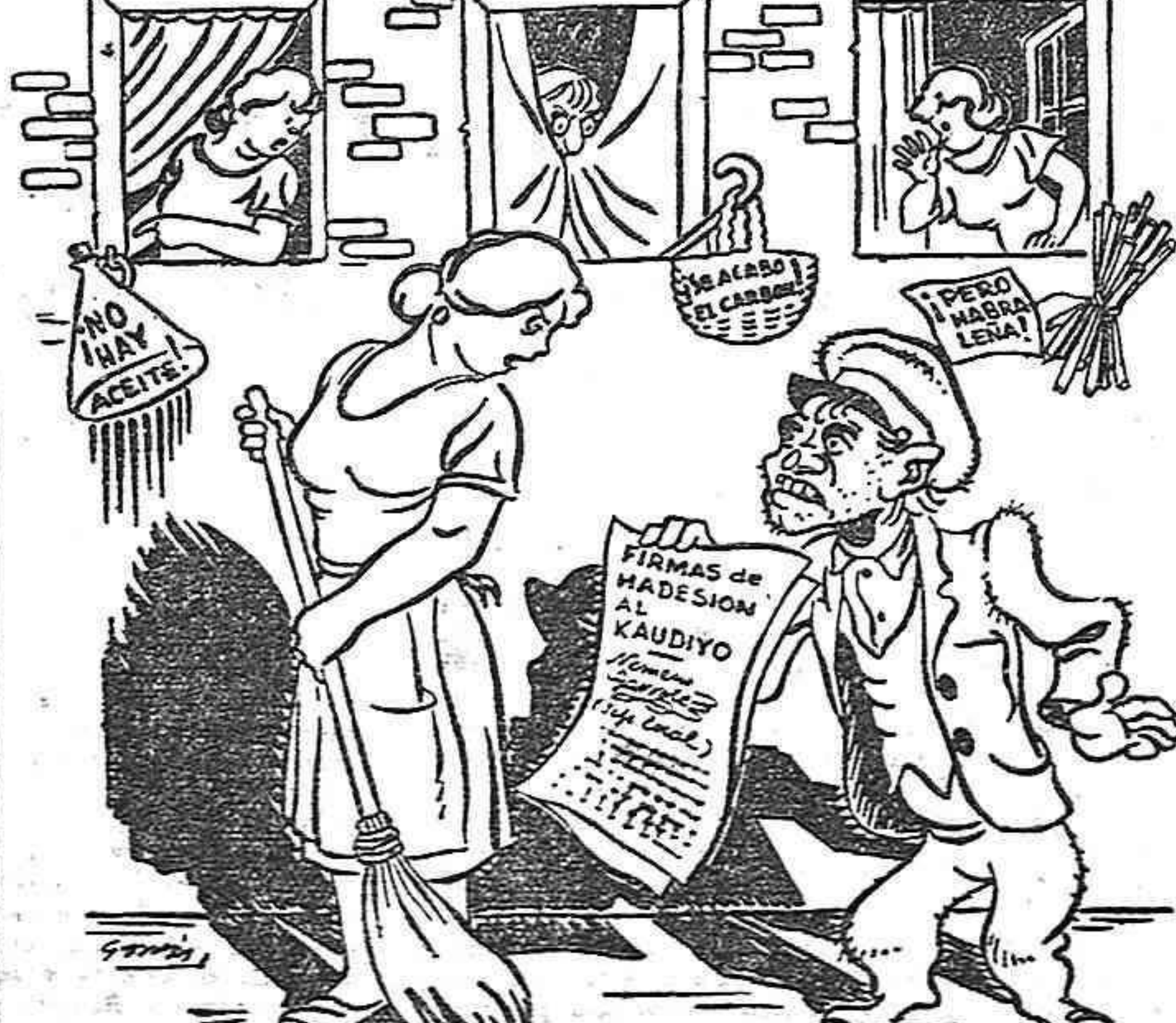
¿Firmar? ¡Con la escoba, si no te largas!

Esta y otras muchas causas relacionadas con la situación franquista en el campo hacen que la oposición contra Franco crezca en las provincias de Almería y Murcia, como en toda España, de manera incesante.