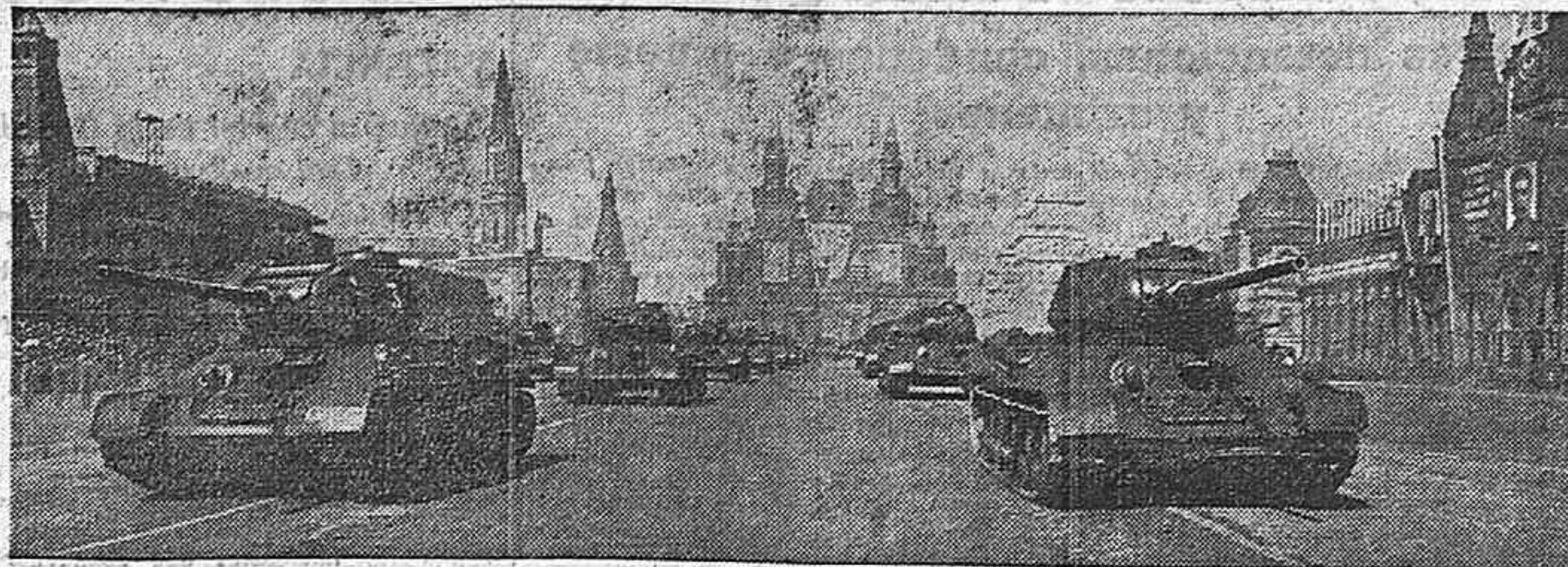
El domingo 8 se celebró en Moscú el «Día del Tanquista» en medio de un gran entusiasmo popular. Durante más de tres horas desfilaron por las calles de la capital soviética varios regimientos de tanques, cubiertos de gloria en las más grandes batallas de la guerra.