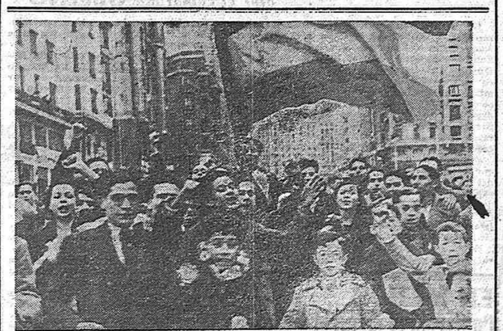
El pueblo español no admite tutelajes extranjeros ni acepta cualquier democracia. La bandera de su lucha es la que flamea en la defensa de Madrid y en el paso del Ebro: la de una República de verdad democrática y además española.

La tarea es inmensa. Pero nuestro Partido puede repetir con orgullo lo que ha afirmado en otras muchas ocasiones. Por grandes que sean las dificultades no renunciaremos ni renunciaremos a nuestra tarea, ni declinaremos otros el honor de realizarla.