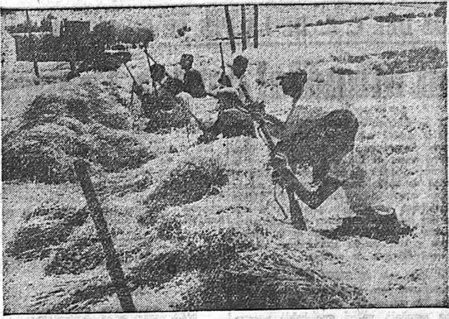
Los campesinos españoles son víctimas, como todo el pueblo, de la política de terror y miseria del régimen franquista.

Diariamente llegan nuevas noticias de torturas en las cárceles y comisarías franquistas, de nuevas detenciones y fusilamientos de patriotas, de nuevos crímenes.