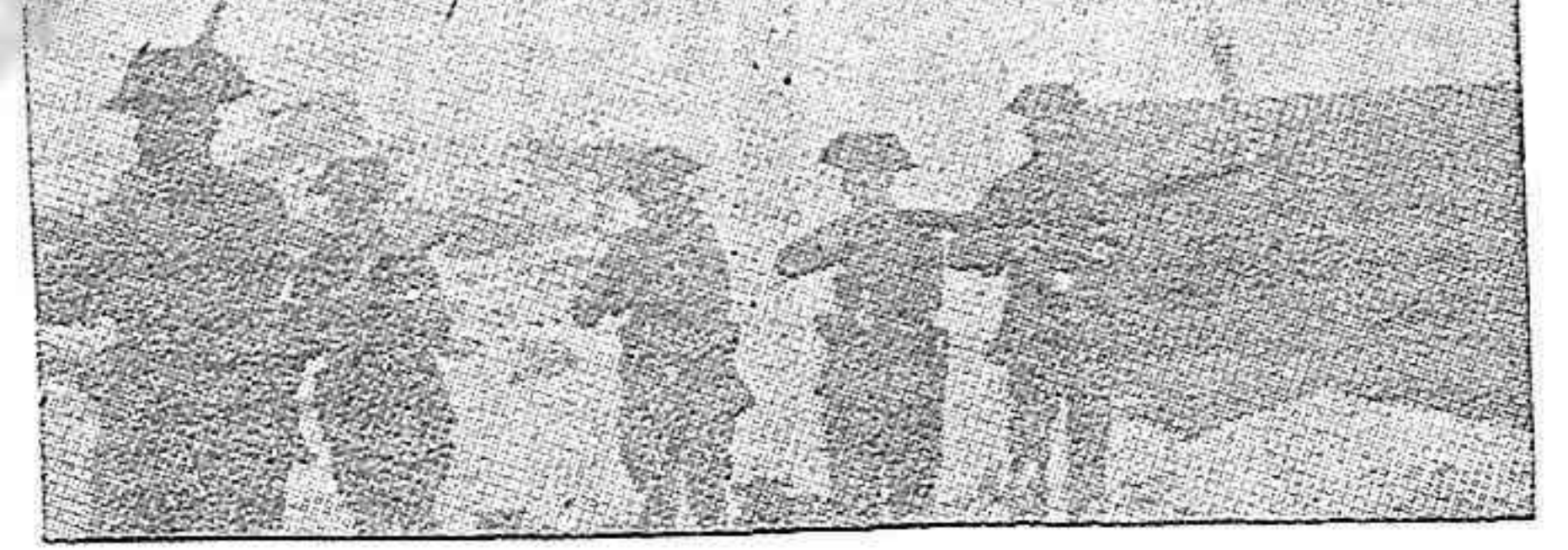
(Foto tomada en España por un corresponsal extranjero.) Grupo de guardias civiles asesiando a los hijos del pueblo.