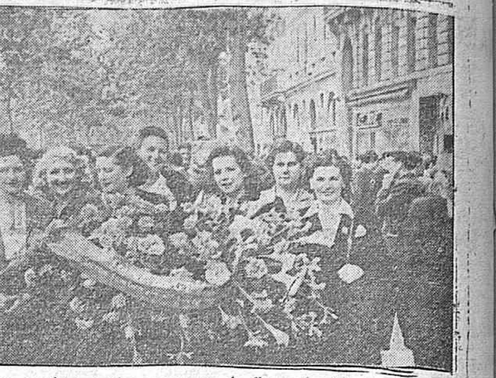
Compañeros ugetistas acuden con ramos de flores al mitin de clausura del II Congreso de la Junta Central de la U. G. T.