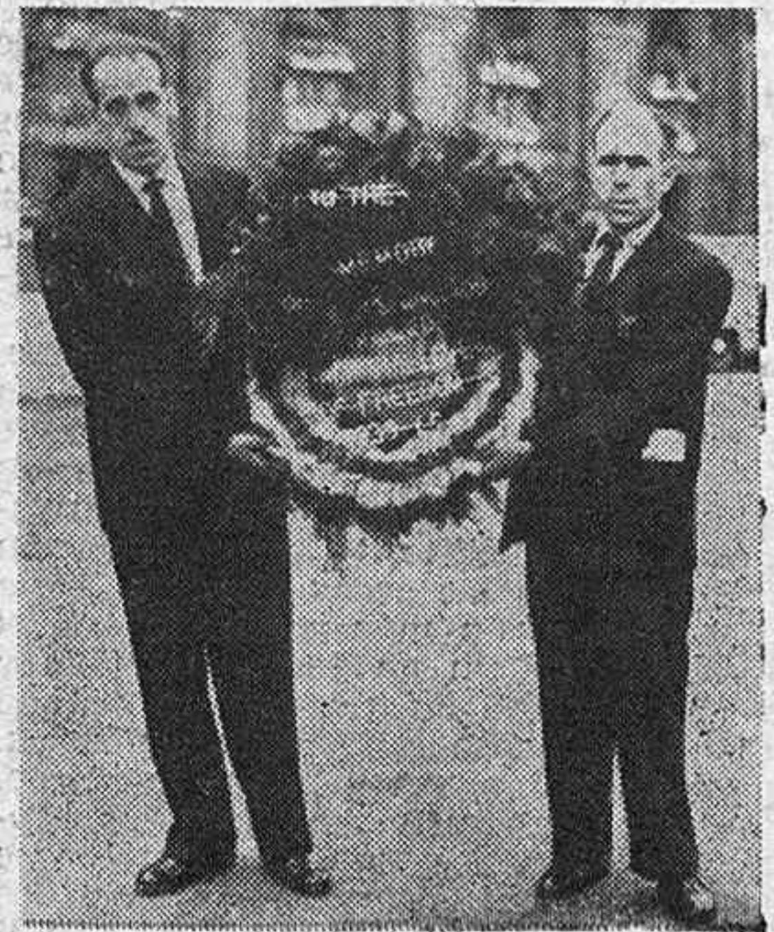
«En memoria de todos los españoles matados por defender la libertad. 1939-45.»

Disuelta la manifestación se depositó una corona de flores en el Cenotafio monumento, situado en White Hall, con la siguiente dedicatoria.