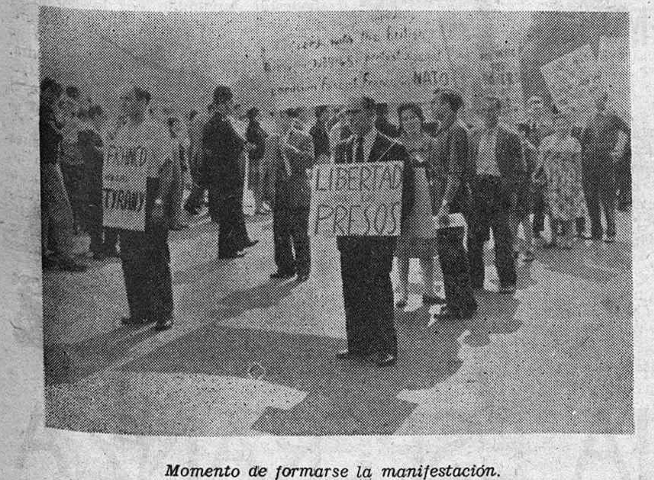
Momento de formarse la manifestación.