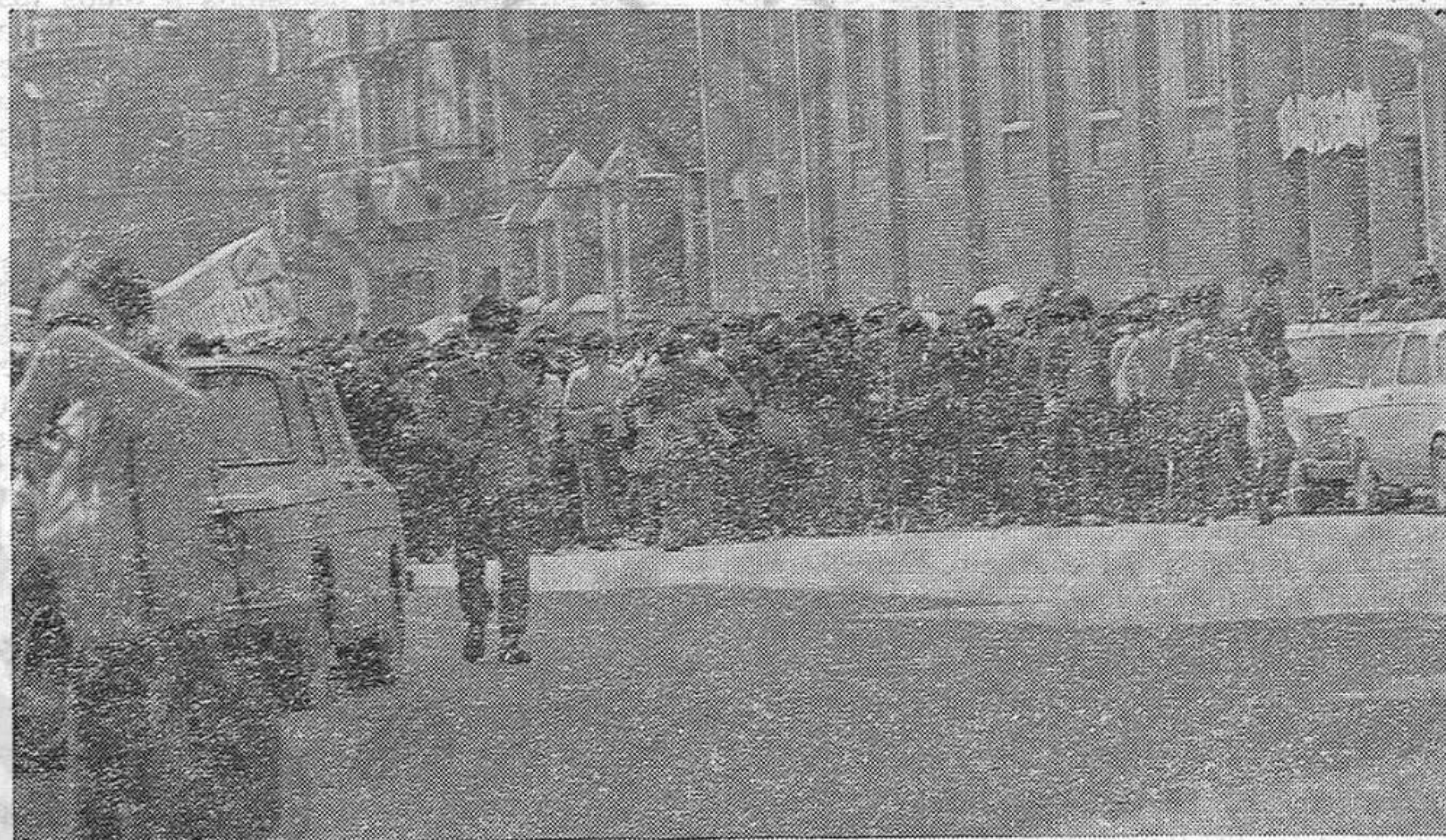
Cabeza de una de las manifestaciones de los estudiantes barceloneses en ayuda del Vietnam. La foto fue tomada en la Travesera de Gracia.