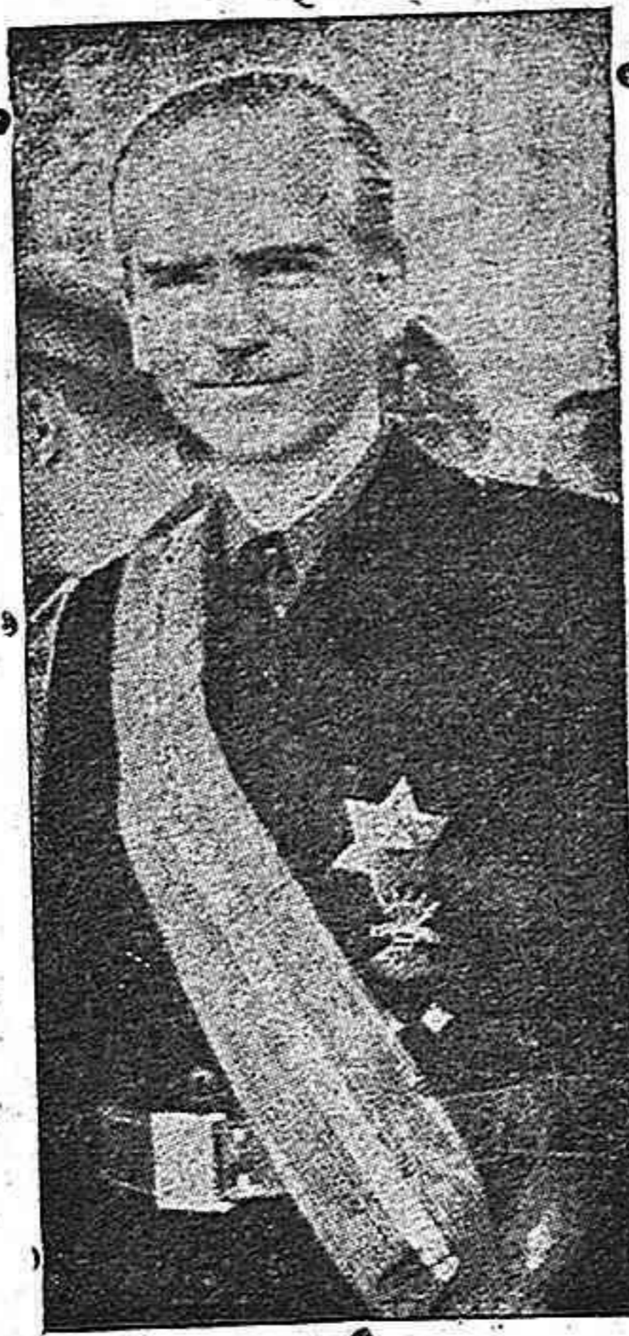
Excelentísimo señor don Ramón Serrano Suñer, presidente de la Junta Política