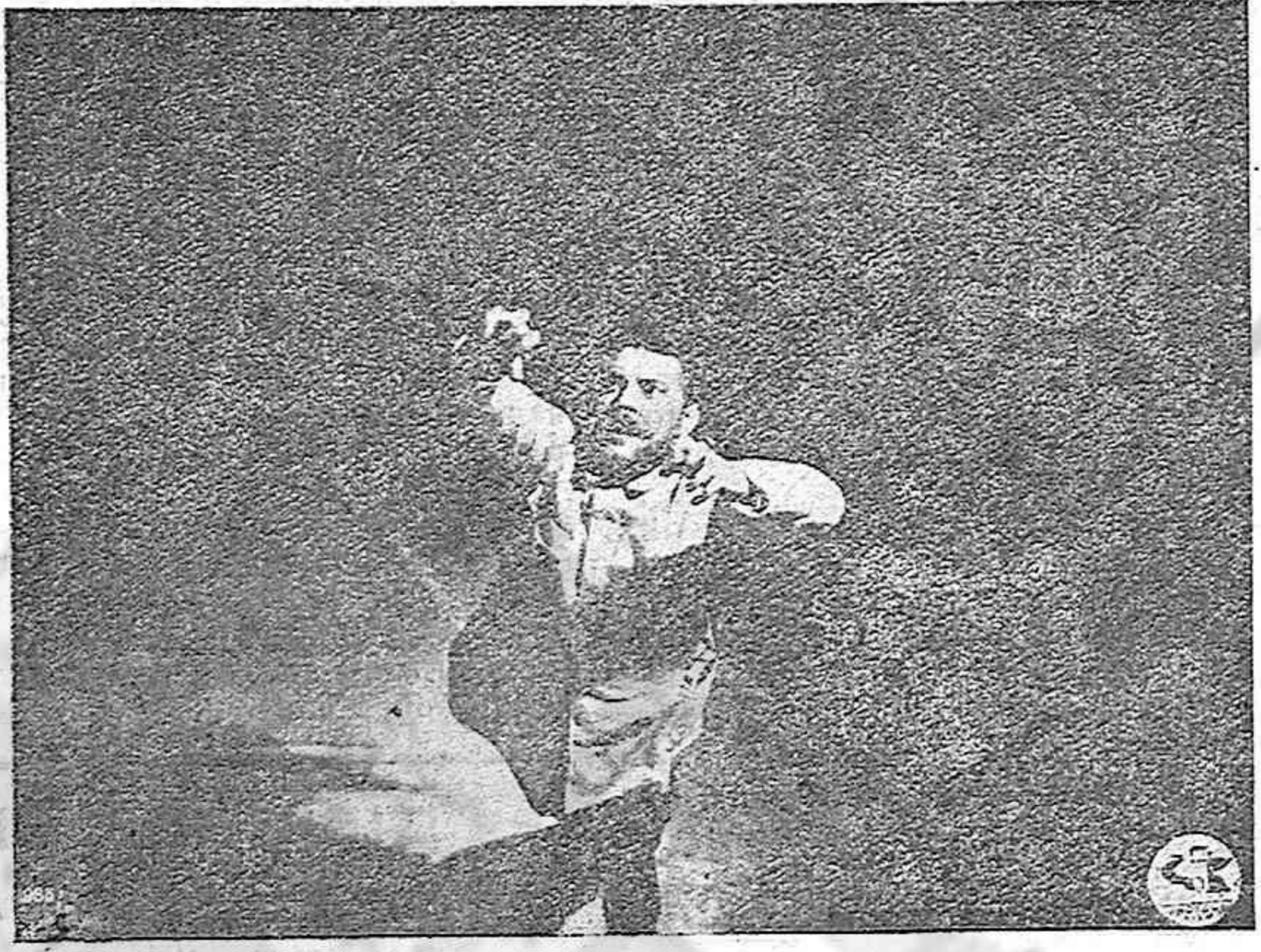
Heinrich George en una escena del «Oriente Expres»

Por sus ojos cruza, sin embargo, un rayo de esperanza. Beatriz está contenta, porque cree que va a descansar definitivamente... II En el trayecto de Bale. En medio del silencio y de la paz del campo; una estación. Una estación perdida en la augusta calma. Una estación, que es como un punto de vida en medio de la campiña amplia y silenciosa, que parecía muerta. Una estación perdida: Pausin. Y en aquella estación un hombre perdido también en el eterno olvido de su oscuridad: Peter Karl. Este hombre de barbas pobladas y bigotes profundos, de mirada escrutadora y joven, es en la vía principal, por donde pasa el expreso de Oriente, un simple empleado; pero sobre la otra vía, por la que pasa un modesto tren de interés local, Peter Karl, es nada menos, que el Jefe de Estación . Peter Karl, tiene un perro fiel, un perro de mirada inteligente y comprensivo instinto. Peter Karl, tiene un compañero. Peter Karl, cuenta con la ternura admirable de Rosette, la hija del fondista. Rosette entonces muy bien con la santa calma de Pausin, con la serenidad de su paisaje, con sus crepúsculos sentimentales y admirables... Rosette, la hija del fondista de Pausin, es la flor sencilla, que da generosa de su aroma de sencillez, sin pensar en que los perfumes excesivos marean. Pero, Peter Karl, a pesar de la fidelidad de su perro y de la ternura admirable de Rosette, no tiene otro compañero que su sueño de ambición.